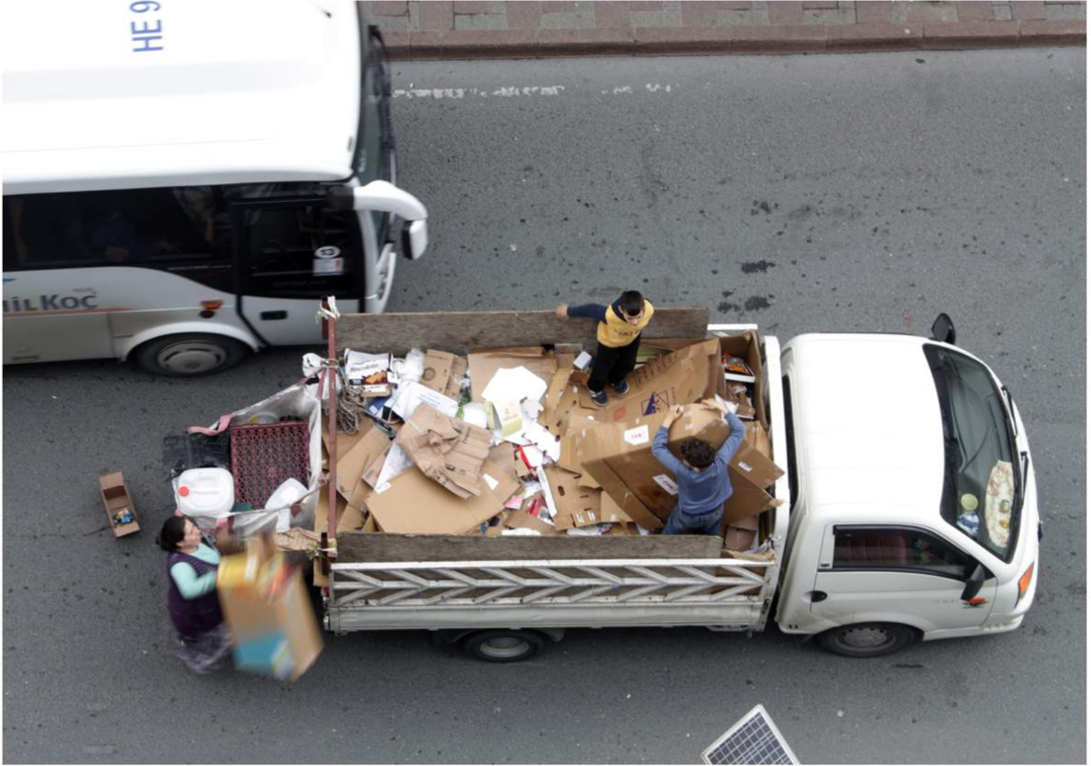
F: Özcan Yaman