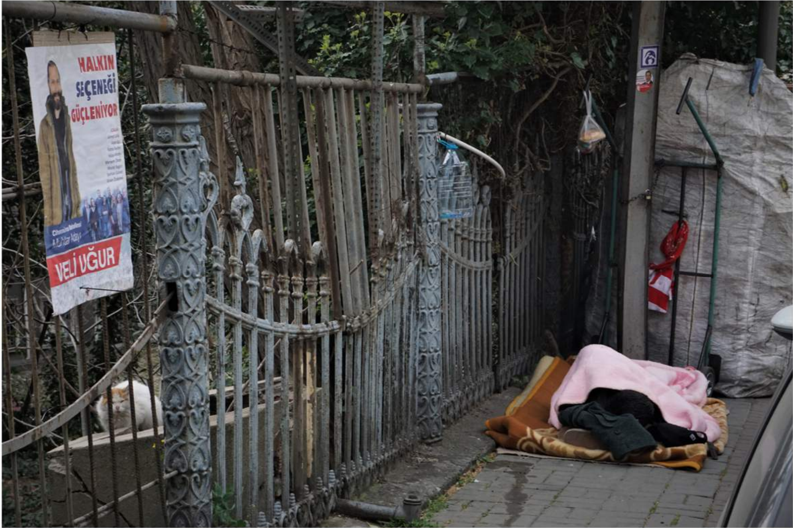
F: Özcan Yaman