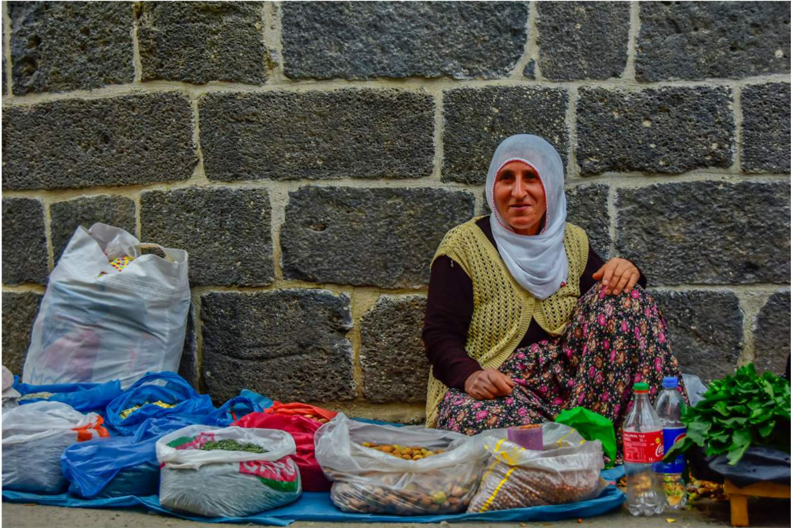
F: Sultan Esen