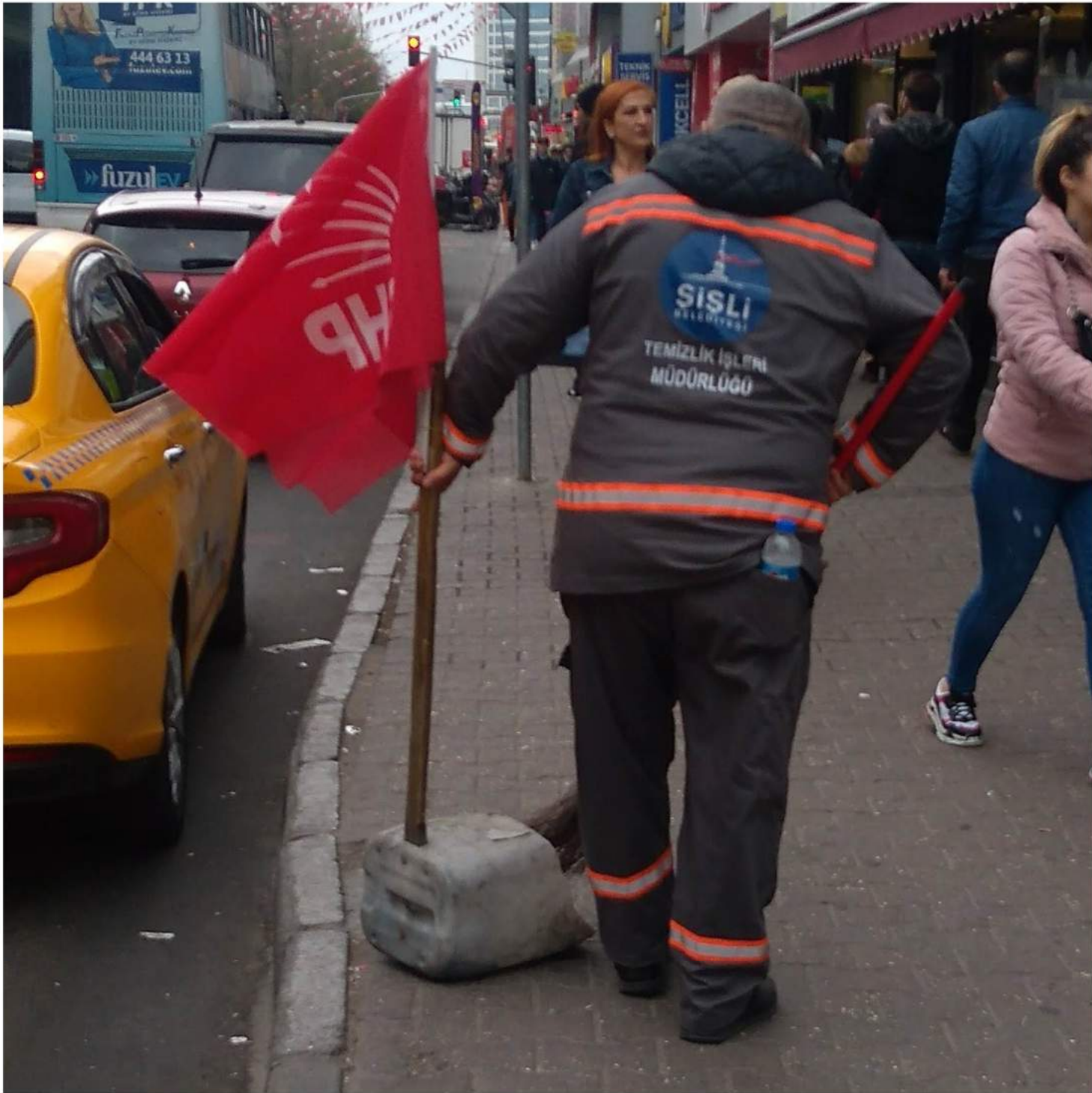
F: Özcan Yaman