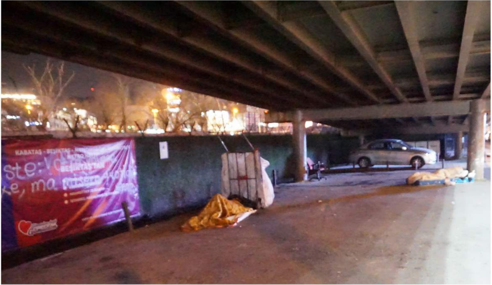
F: Özcan Yaman