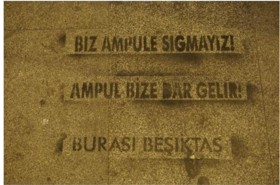
F: Özcan Yaman