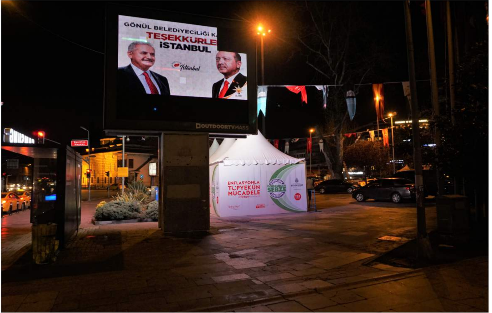
F: Özcan Yaman