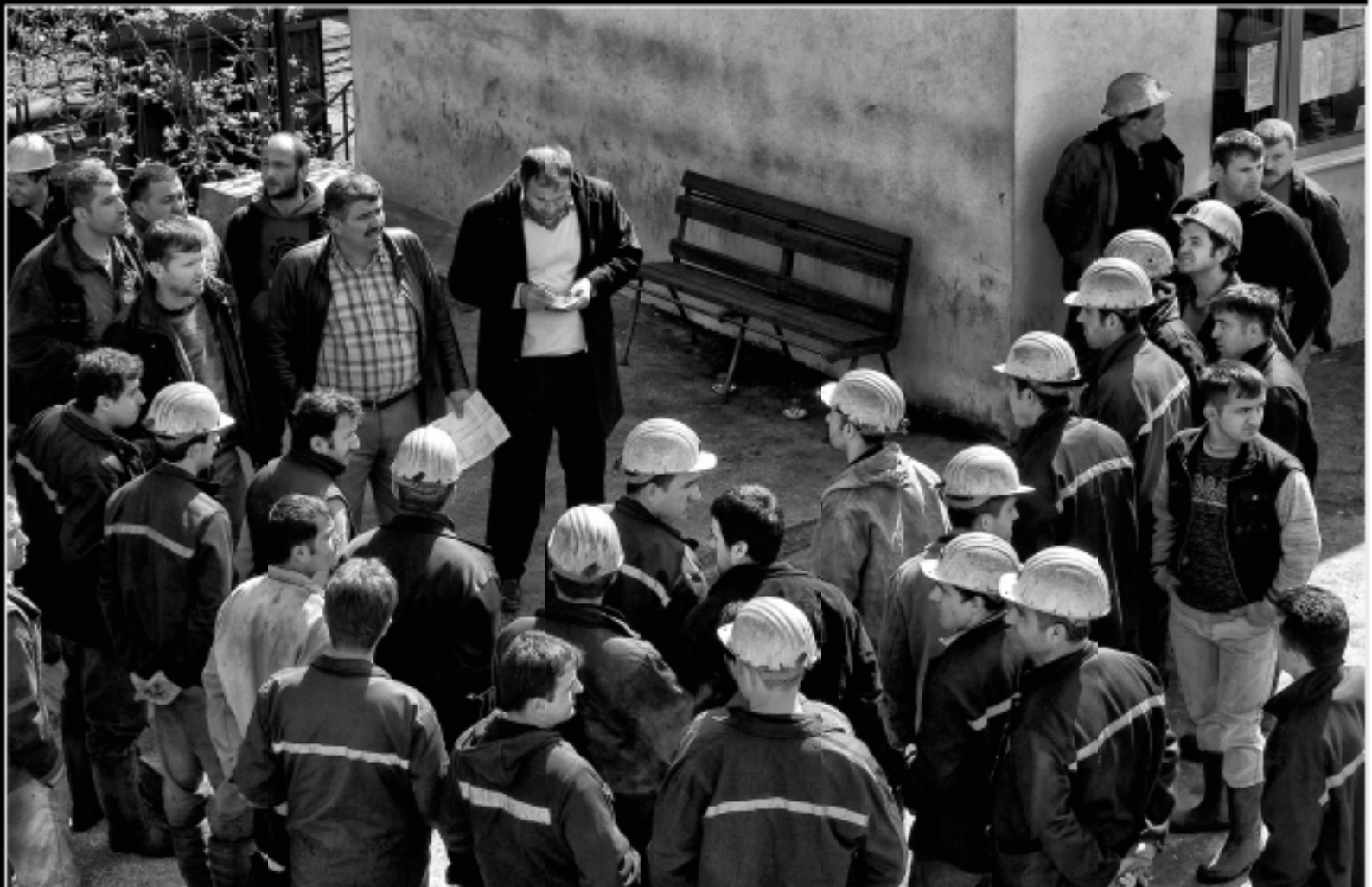
redfotoğraf: Kadir Çelep