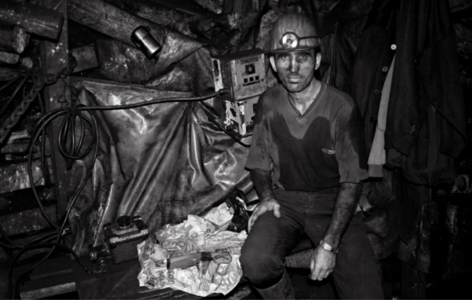
redfotoğraf: Mehmet Üzer