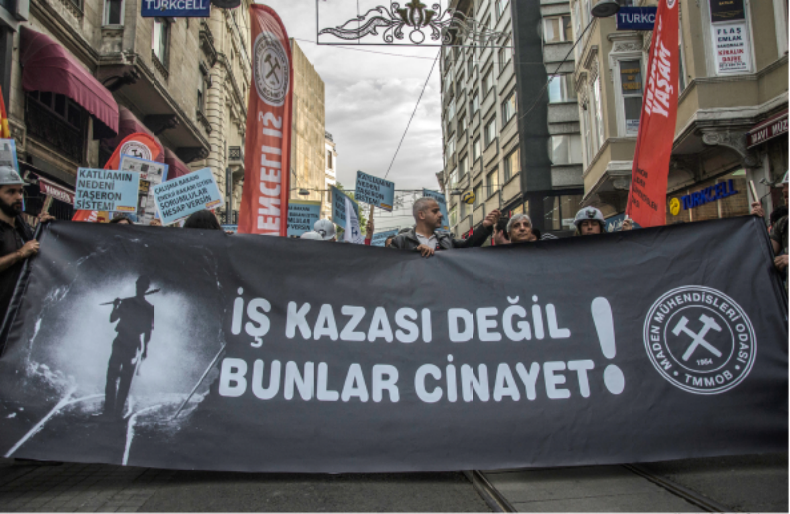
redfotoğraf: Çetin Şeker