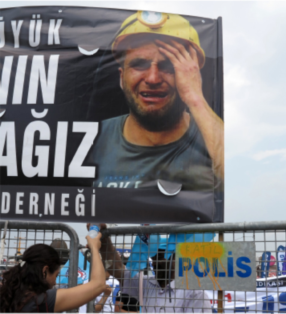
redfotoğraf: SULTAN GÜNER