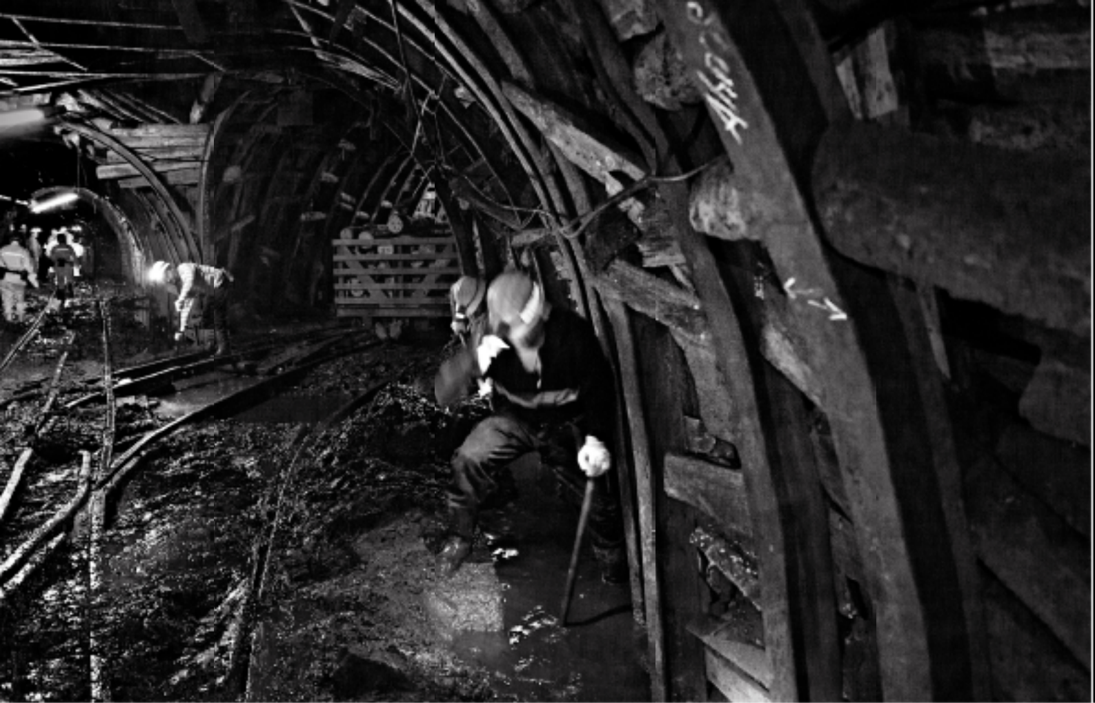
redfotoğraf: Gökhan Eren Kamer