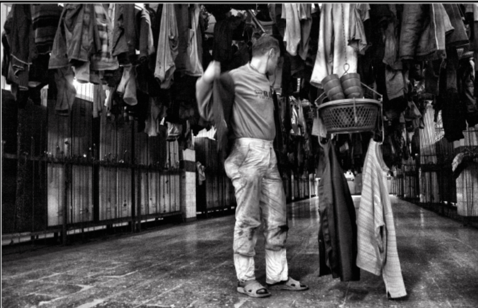
redfotoğraf: Kadir Çelep