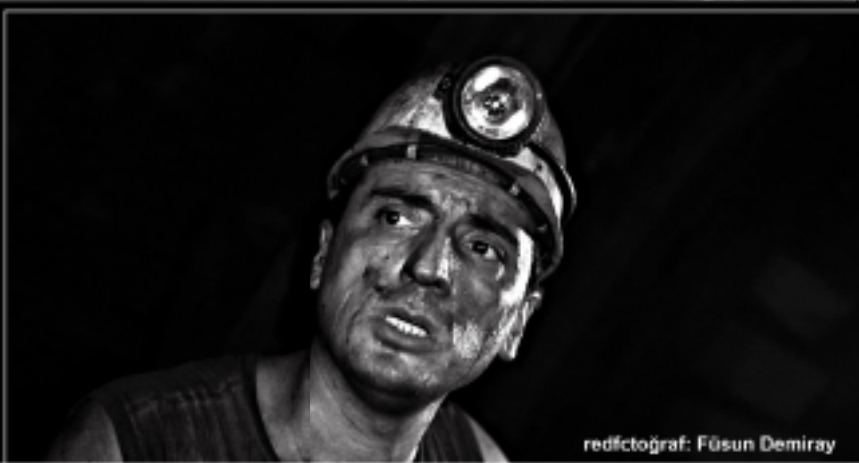
redfotoğraf: Füsün Demiray