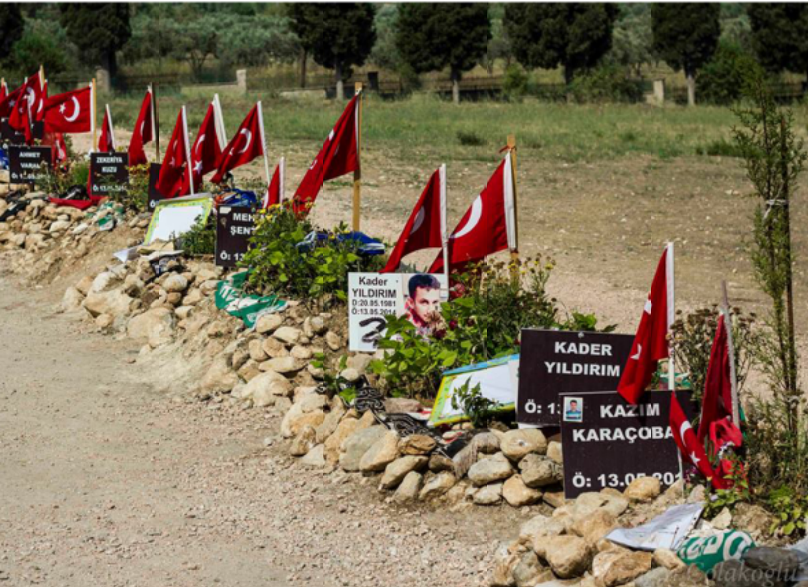
redfotoğraf: Engin Çolakoğlu