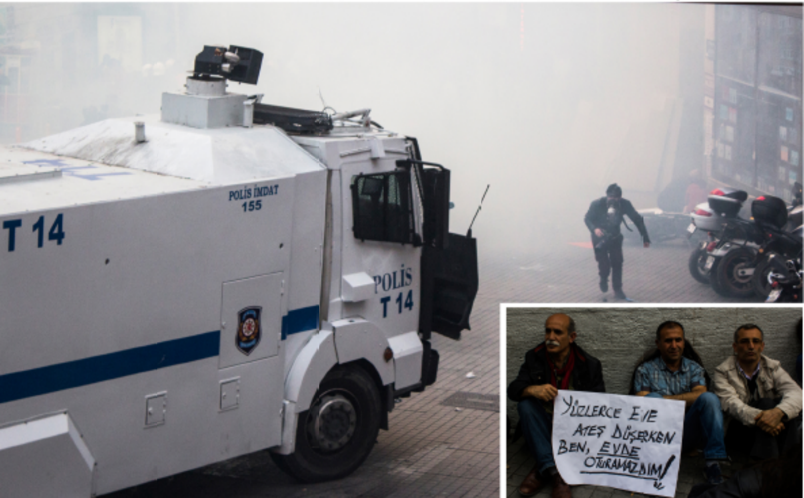
redfotoğraf: Yeşim Oğuz