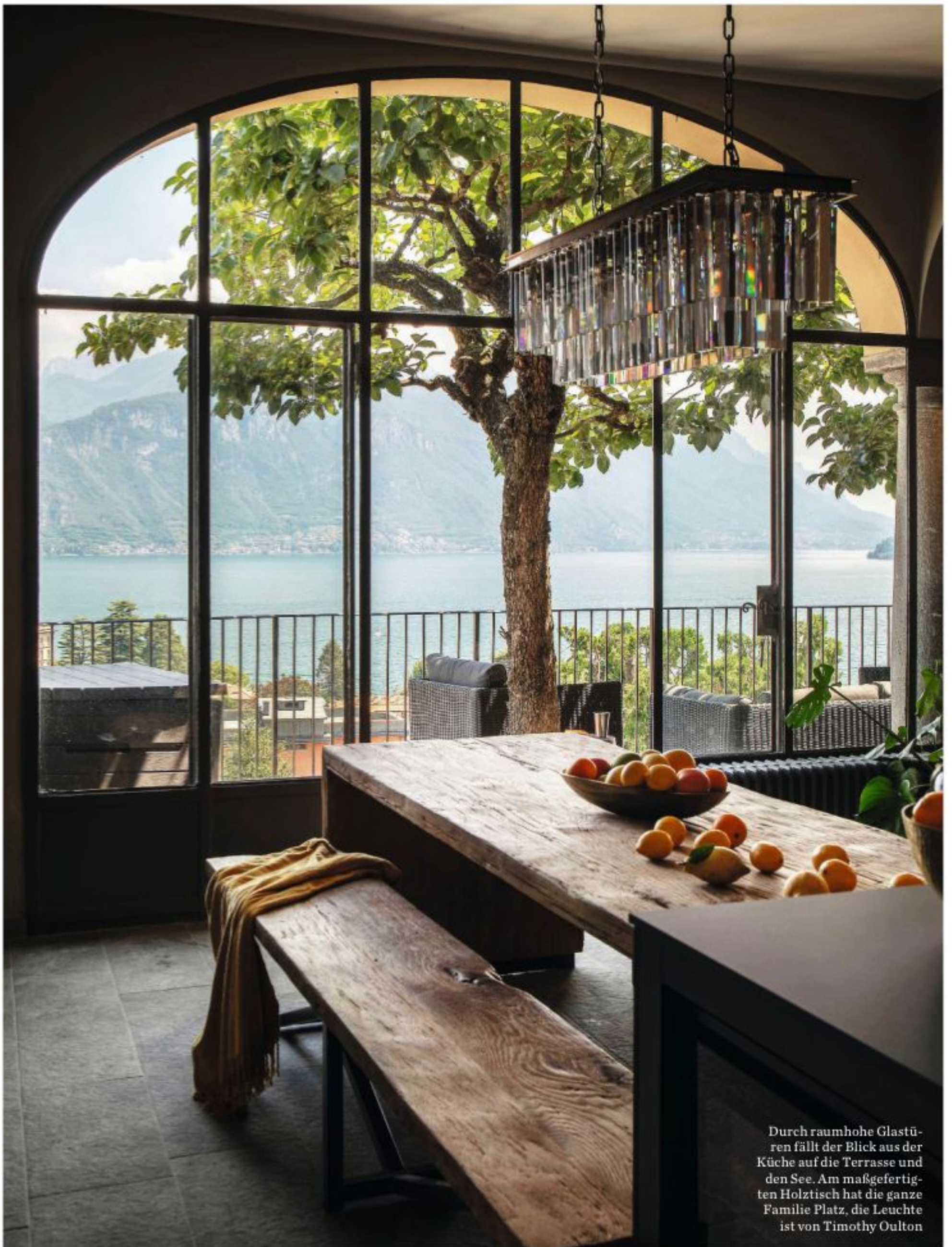
Durch raumhohe Glastüren fällt der Blick aus der Küche auf die Terrasse und den See. Am maßgefertigten Holztisch hat die ganze Familie Platz, die Leuchte ist von Timothy Oulton