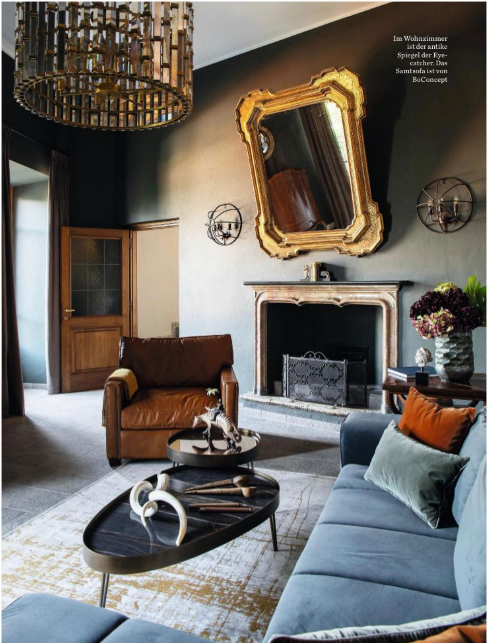
Im Wohnzimmer ist der antike Spiegel der Eye- catcher. Das Samtsofa ist von BoConcept