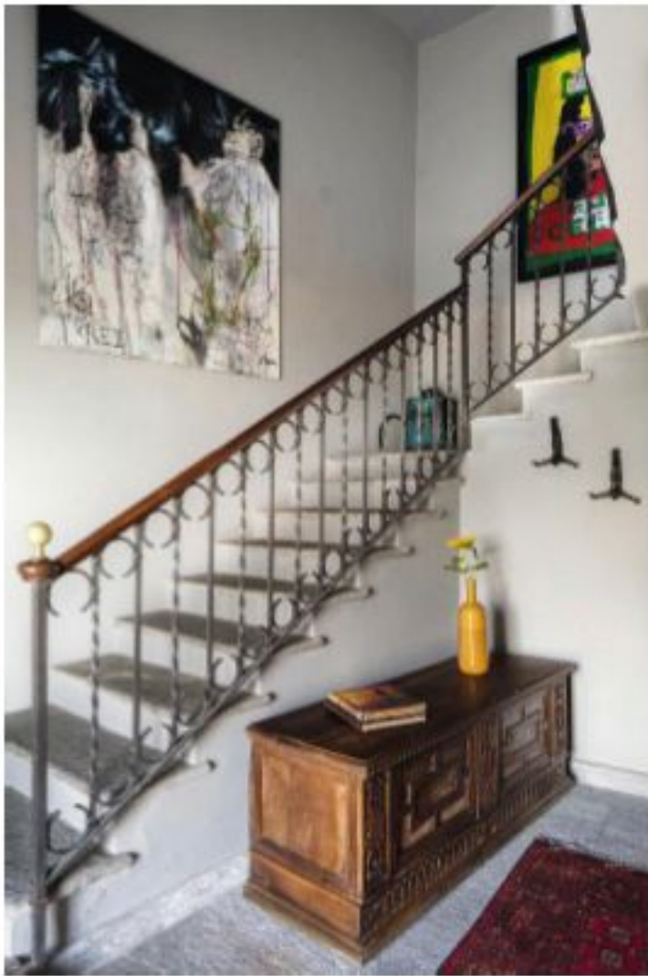
Oben: Die Treppe, die bis in den dritten Stock führt, ist aus lokalem Moltrasio-Stein, auch der Handlauf ist noch original. Der Teppich und die Kunst sind aus Südafrika, dem Heimatland der Hausherren. Rechts: In allen vier Schlafzimmern des Hauses finden sich Himmelbetten von Gallery Direct UK und Tapeten von Jane Clay