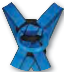
BUCLE DORSAL FLEXIBLE