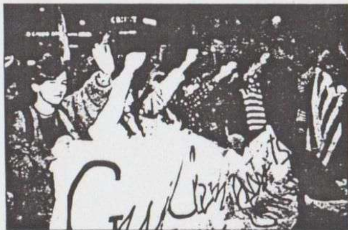
Un grupo de «maulets» canta «La Moixeranga».