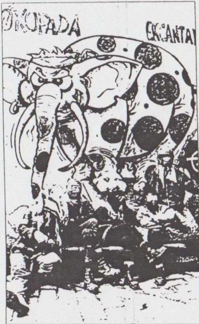
CARLES FRANCESC Cinco okupas posan bajo un mural del Kasal Popular de Valencia.

El espectáculo continuó al día siguiente en el Kasal Popular, que fue cercado durante la mañana por los nacionales. Muy teatralmente se subieron cuatro okupas al tejado haciendo como que se preparaban para defenderse del "asalto" policial, mientras sus abogadillos, que curiosamente pasaban por allí, mostraban a la policía todos los papeles de aquel OKUPA que de "ocupado" no tenía nada. Es fácil ir de okupa cuando por la noche vuelves a casa de los papás, en un buen barrio, a dormir, a que te den de comer y te suelten el dinero suficiente para seguir yendo de "tirao" pero sin correr riesgos, ¿qué emocionante!.