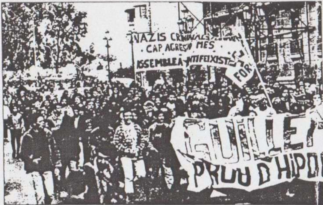
Aspecto de la cabeza de la manifestación ante la Capitanía General.

El recorrido concluyó en la plaza del Ayuntamiento, donde los manifestantes, con el puño