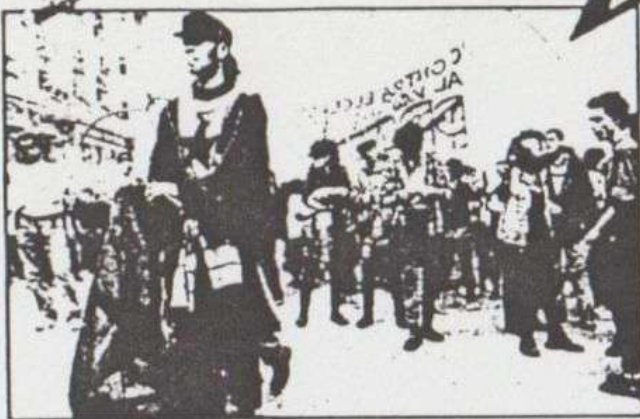
Los «okupas» protestaron antes de la «mascletà».

El día 19 se pasearon por la mascletà para protestar por la represión policial. Supongo que se quejarían de que la policía no les dio suficientes facilidades en sus agresiones. Tampoco tuvieron ningún detenido, con lo que no pudieron patallar y lloriquear como tanto les gusta.