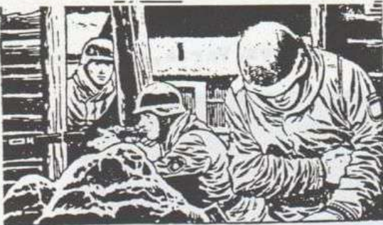
LOS DIVISIONARIOS ESPAÑOLES PENETRAN VICTORIOSAMENTE EN EL PUEBLO.