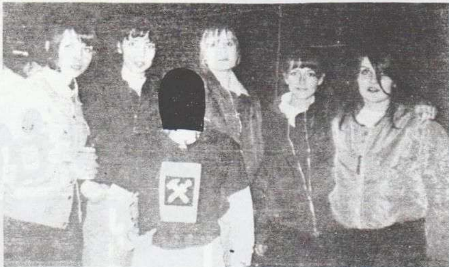
Chicas skins, de izquierda a derecha, francesa, portuguesa, española, inglesa y dos francesas mas.

El segundo grupo fueron los valencianos Division 250, tras una breve pre