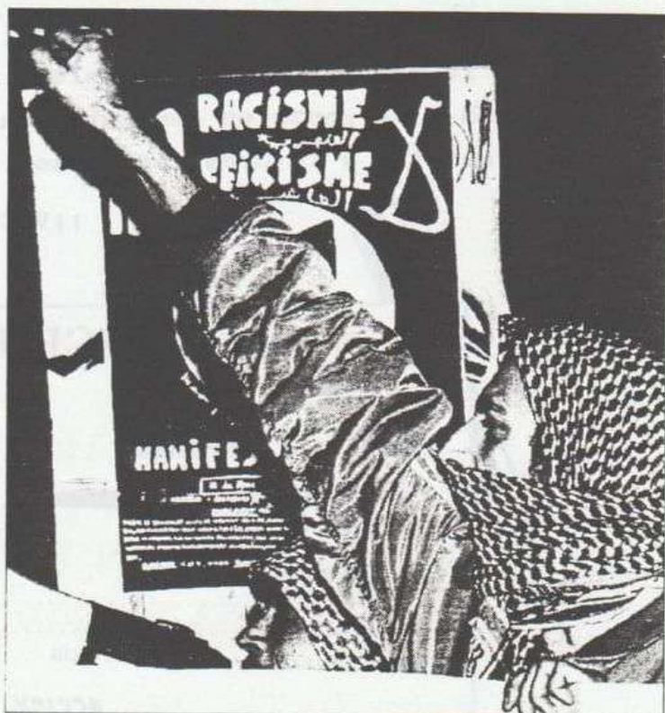
F. B. Los manifestantes profirieron gritos contra el racismo.