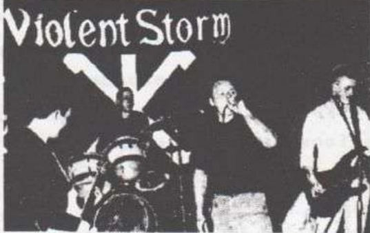
VICTIMS: Violent Storm at one of their concerts

NEW rules have been issued warning Vatican staff - from cardinals to cleaners - to beware of bribes and not be too pally with the press.