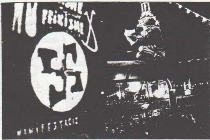
Al final de la marcha se leyó un comunicado.