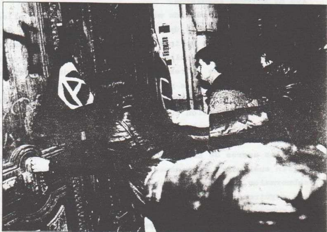
Algunos exaltados intentaron derribar la puerta de la sede de Falange.