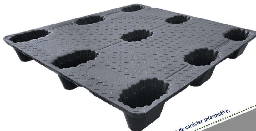
Imagen únicamente de carácter informativo.

Av. Fray Luis de León 8051 Col Centro Sur Querétaro, Qro. CP 76090