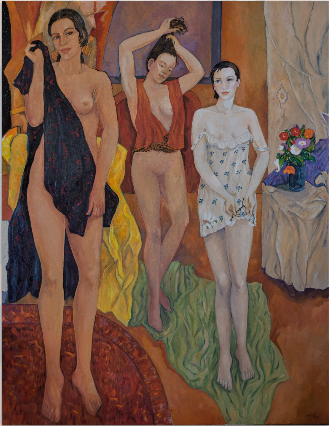
Three figures , 2022, Oil on Linen, 200 x 155 cm, "Women" Series © Stefano Puleo