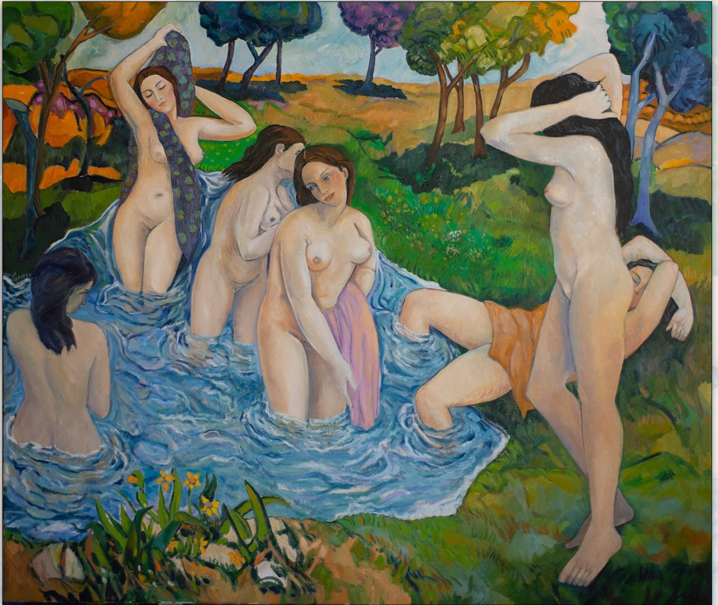
Bathers , 2023, Oil on Linen, 120 x 140 cm, "Women" Series © Stefano Puleo