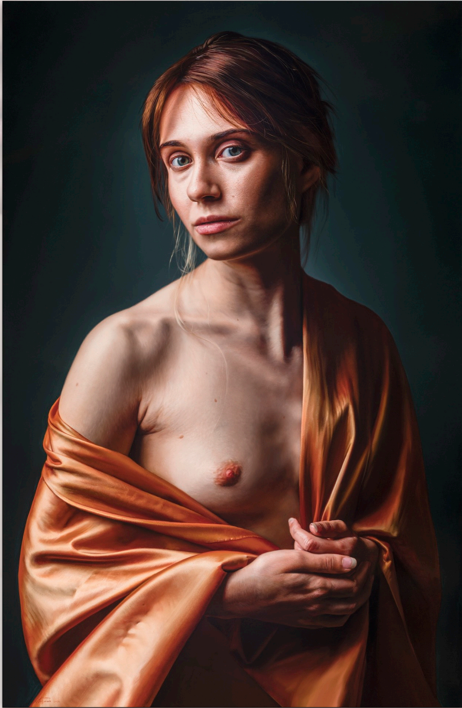
Irene , Feb. 2023, Oil on Polyester, 91 x 60 cm, "Irene" Sessions, "Girls" Series" © Javier Arizabalo