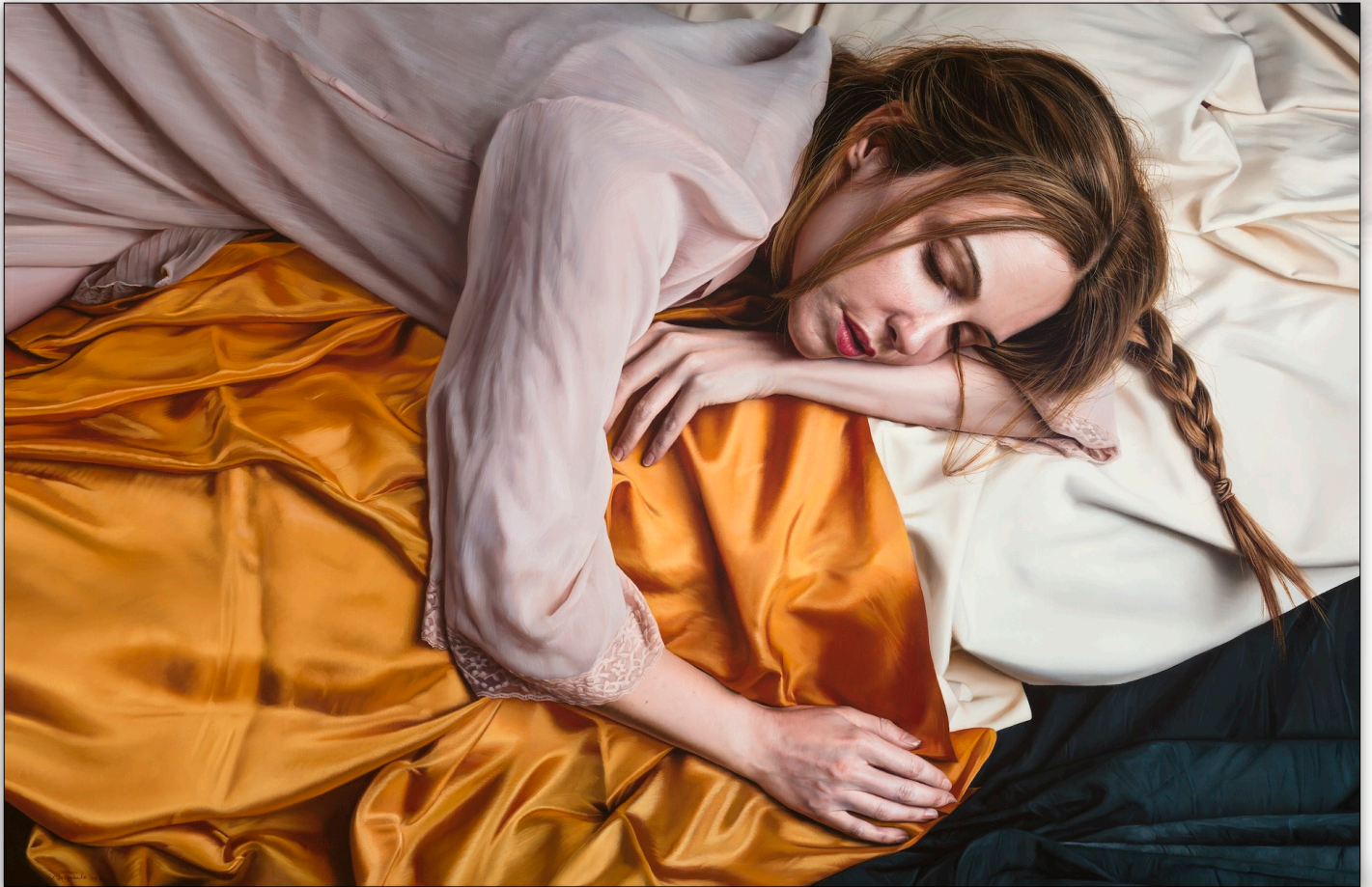
Monica , Mar. 2022, Oil on Canvas, 60 x 92 cm, "Monica" Sessions, "Girls" Series © Javier Arizabalo