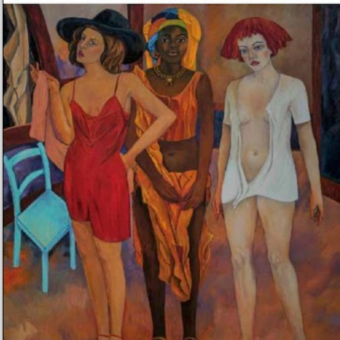
El título de un libro sobre su vida sería "El jardín de los sueños: naturaleza y colores en los cuadros de Stefano Puleo", señala el pintor italiano.