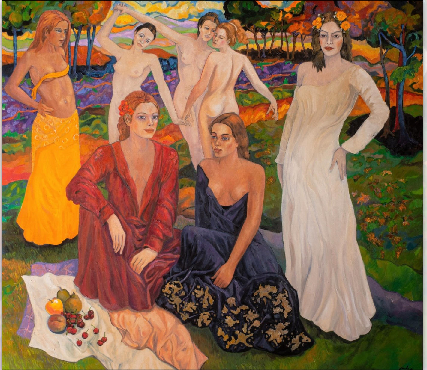
A particular day , 2022, Oil on Linen, 145 x 165 cm, "Women" Series © Stefano Puleo