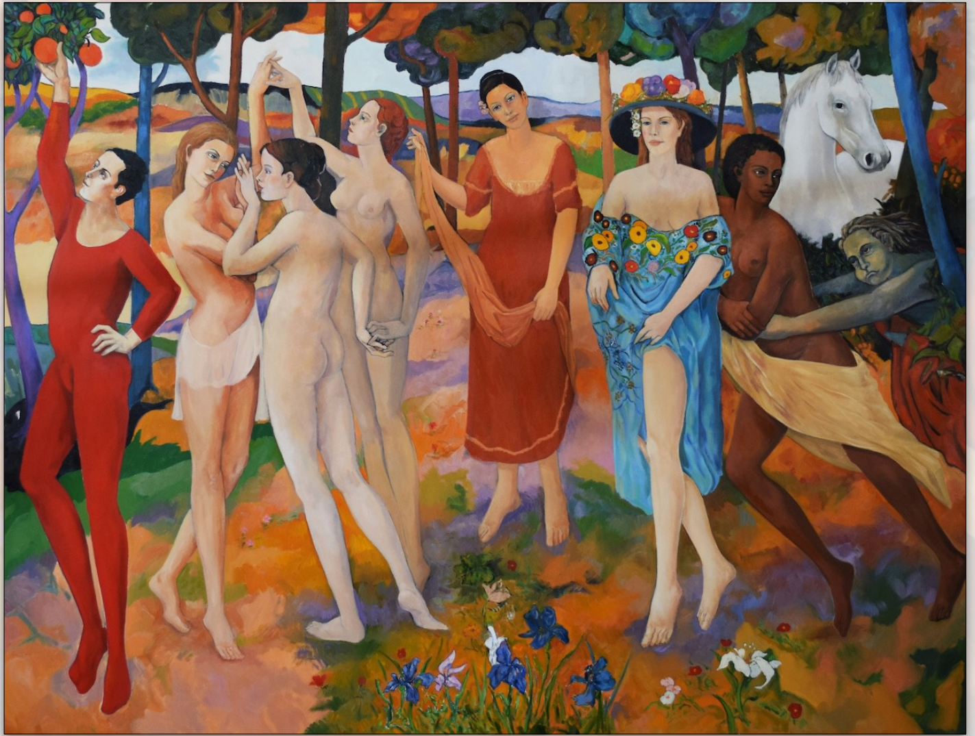
Spring , 2021, Oil on Canvas, 150 x 200 cm, "Women" Series © Stefano Puleo