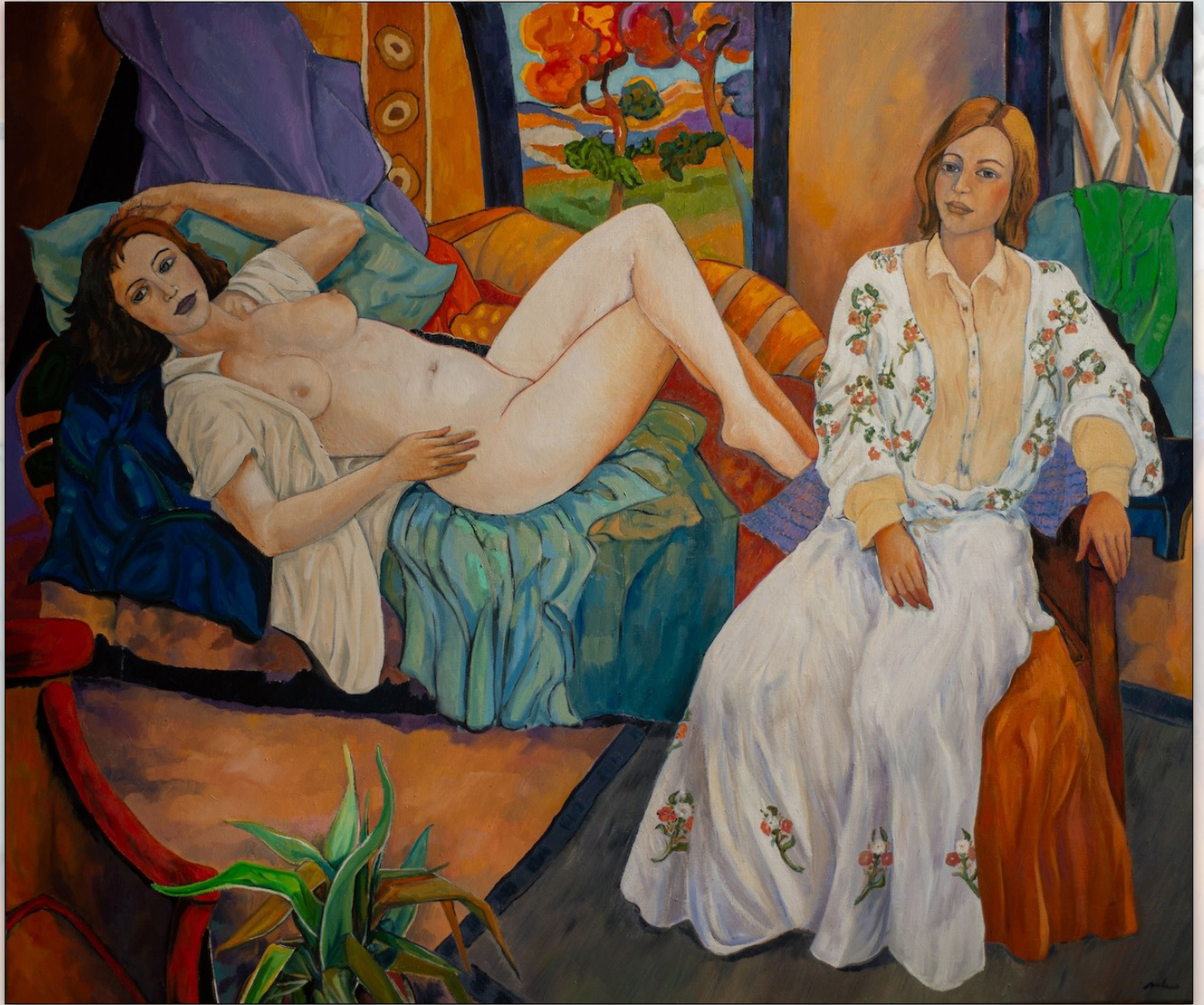
Sacred and profane love , 2022, Oil on Linen, 135 x 160 cm, "Women" Series © Stefano Puleo