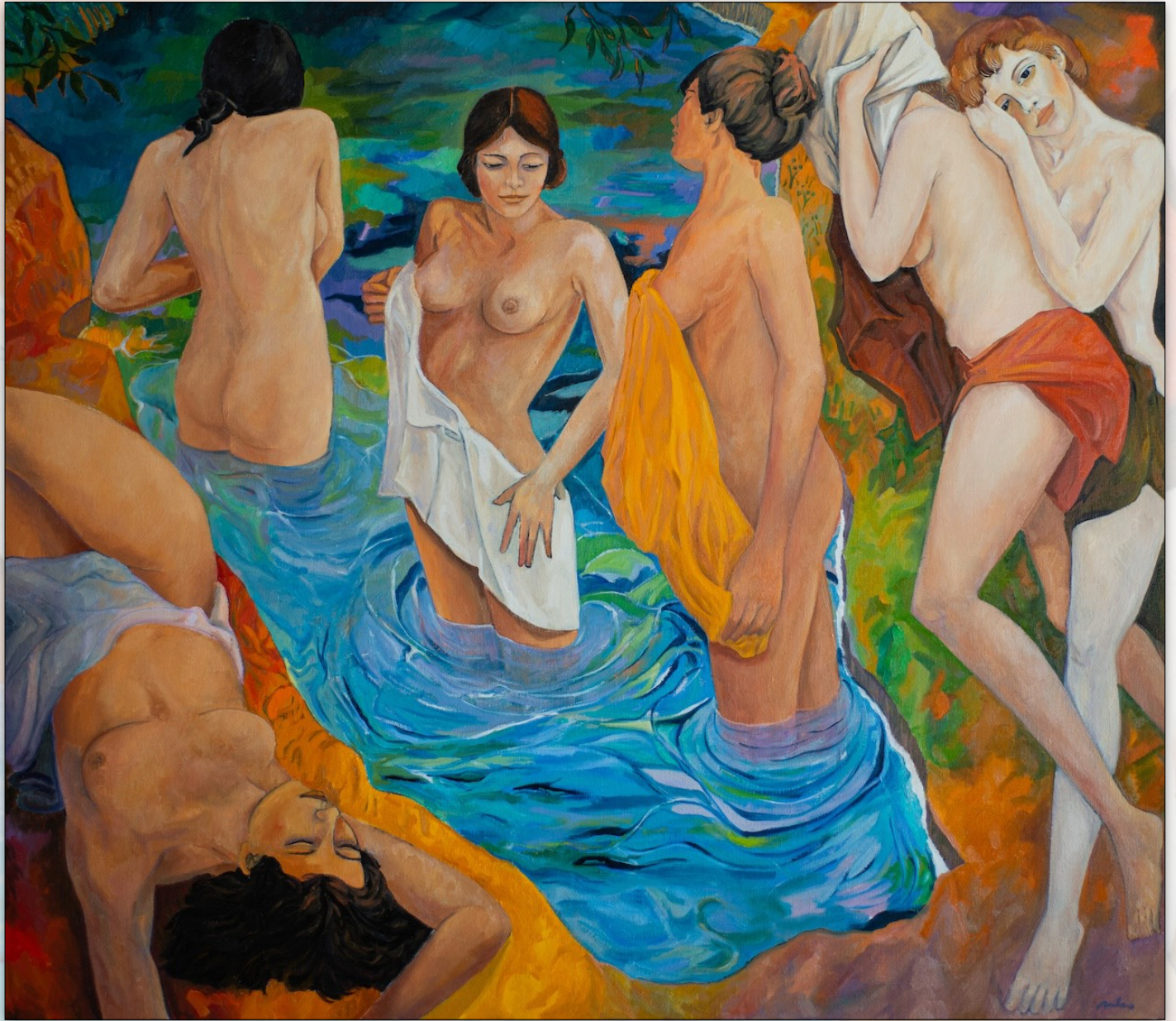
Bathers , 2021, Oil on Linen, 140 x 160 cm, "Women" Series © Stefano Puleo