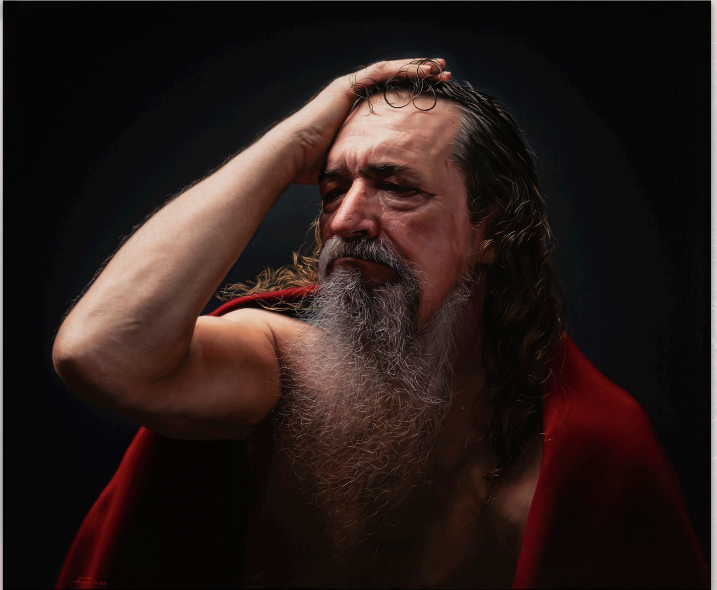
Guillermo , Aug. 2021, Oil on Canvas, 54 x 65 cm, "Guillermo" Sessions, "Men" Series © Javier Arizabalo