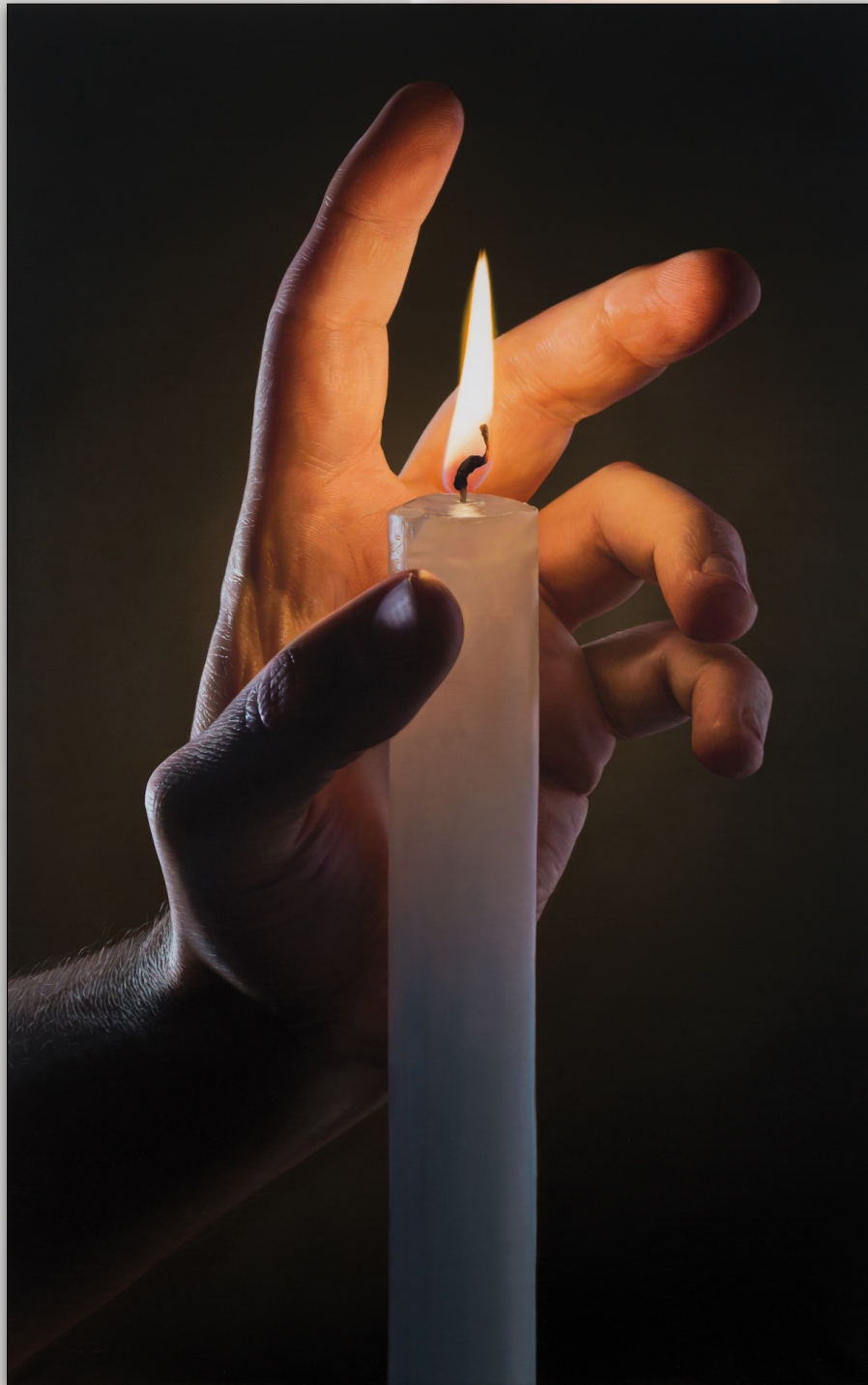
Hand with candle , Apr. 2017, Oil on Canvas, 116 x 73 cm, "Hands" Series © Javier Arizabalo