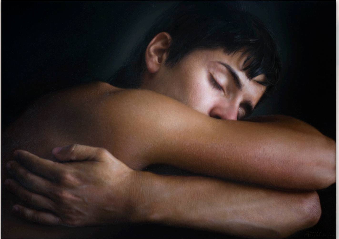
Jabo , Jun. 2010, Oil on Canvas, 33 x 46 cm, “Jabo” Sessions, “Boys” Series © Javier Arizabalo