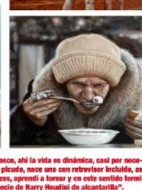
“Haci y crecí en el barrio de San Juan Bosco, ahí la vida es dinámica, casi por necesidad una debe estar atento y con el ojo alerta, se debe usar con reticencia incluido, así crecí, educado a martillazos y banqueros, aprendí a hacer y en este sentido termino uno convertido en escapista, una especie de Harry Houdini de alcantarilla”.