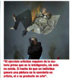
“El ejercicio artístico requiere de la materia prima que es la inteligencia, sin esta no existe. El hecho de que un individuo genere una pintura no lo convierte en artista, ni a su producto en arte”.

con la misma problemática una y otra vez, es como un loop infinito. ¿Cuál ha sido tu mayor satisfacción en la industria del arte? Vivir y hacer vivir a los míos de lo que hago, como todo profesional, siempre es motivante. Encontrar espíritus afines que entienden, comparten, se ven en los ojos y hasta compran tus engrudos, es una gloriosa satisfacción. ¿Cuál es tu meta como artista? No existe un largo plazo, por lo tanto no hay meta, a corto plazo es hacer mi mejor pieza cada que inicio la siguiente. Es inevitable un blanco para el dardo-orientado del arte. La pintura es una granada de fragmentación que se estalla en la mano, no es construido en medidas estándares. ¿Por qué te interesa algo nuevo en el arte? No estoy seguro de aportar algo nuevo, lo que sí sé es que mi trabajo está hecho desde adentro, desde lo individual, resulta imposible que sea igual que otro... paradójicamente eso lo vuelve universal. ¿Por qué el arte es importante en nuestra vida?