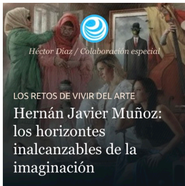
Héctor Díaz / Colaboración especial