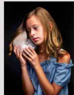
Ane, 2020 Óleo sobre Tela, 92 x 60 cm 98,000.00 MXN