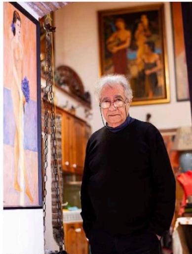
El artista Stefano Puleo es reconocido como uno de los más Fauvistas vivos más importantes de Europa.

"PINTO PORQUE ME MUEVE LA PASIÓN, DE LA QUE PROVIENE EL PLACER DE CREAR, EL AMOR POR LA SOLEDAD Y LA ENERGÍA PARA TRASCENDER".