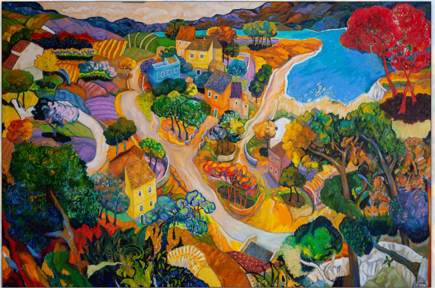
Mediterranean landscape , 2022, Oil on Linen, 200 x 300 cm, "Landscapes" Series © Stefano Puleo