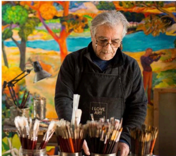
“El artista crea, comunica y transmite sus emociones e impresiones en las obras. Un pintor simplemente pinta”, decía Stefano Puleo.

Creo que le falta la visibilidad de la construcción del color y su densidad. Cada color se compone de varios tonos, a menudo complementarios, que crean vibraciones a la pintura. Dado que se trata de gradación