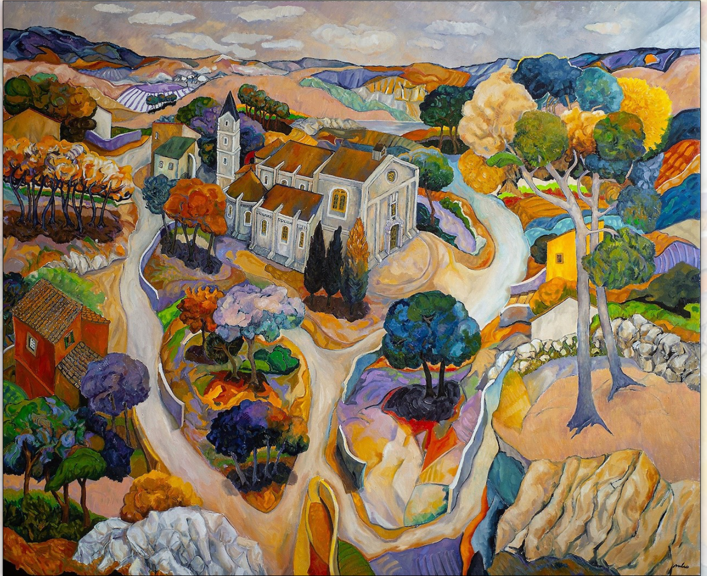
Cathedral , 2022, Oil on Linen, 165 x 200 cm, "Landscapes" Series © Stefano Puleo