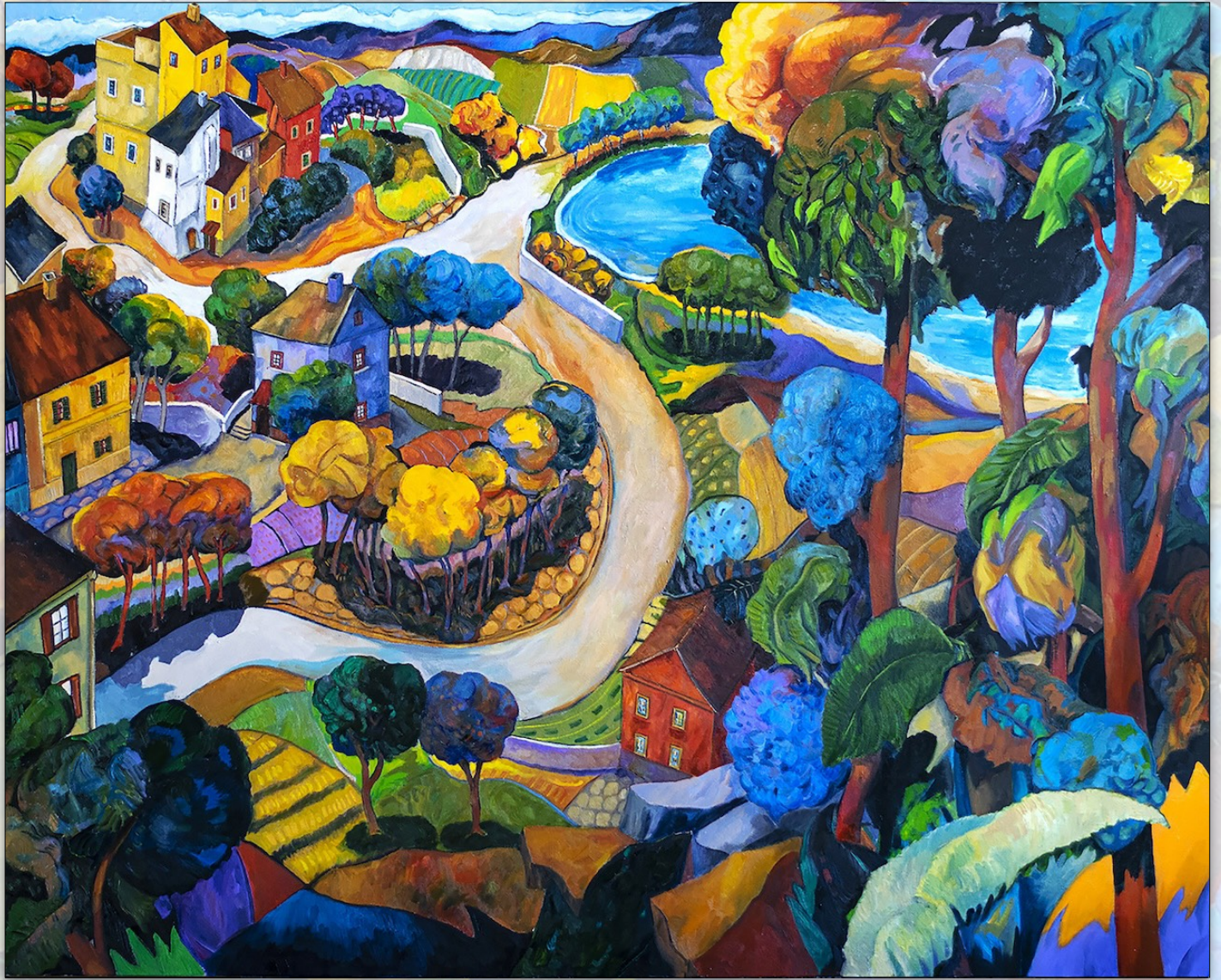
Glimpse of the lake , 2020, Oil on Linen, 160 x 200 cm, "Landscapes" Series © Stefano Puleo