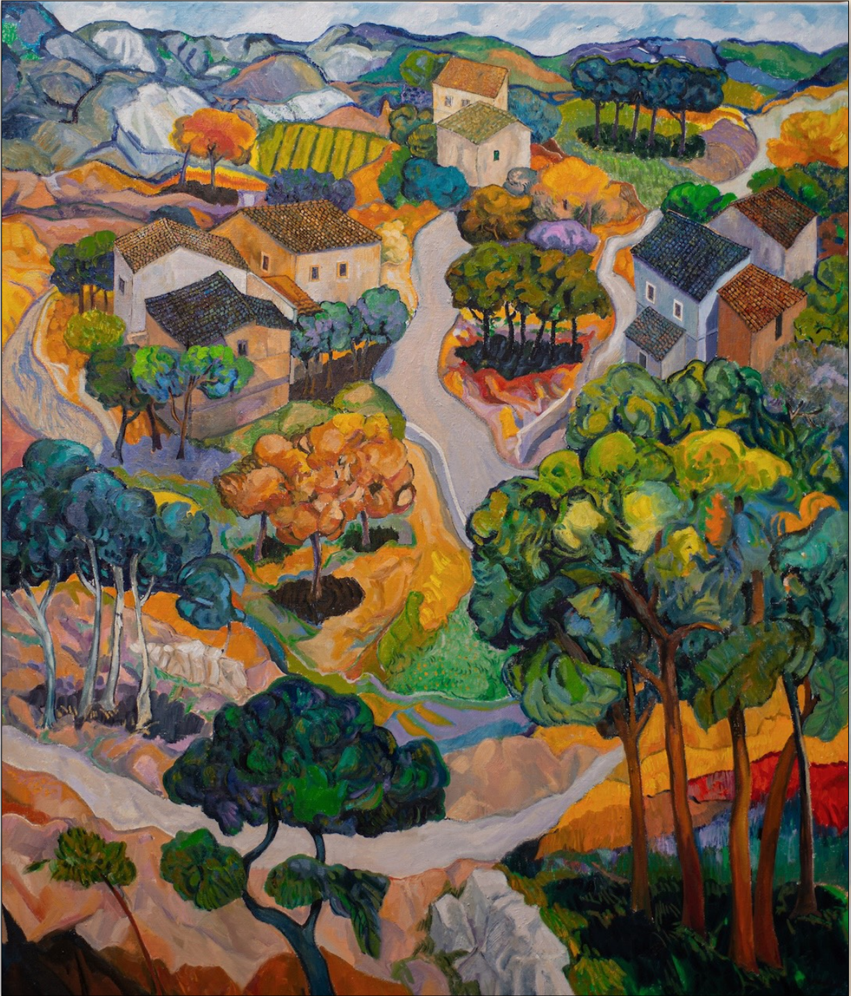
Landscape , 2023, Oil on Linen, 140 x 120 cm, "Landscapes" Series © Stefano Puleo