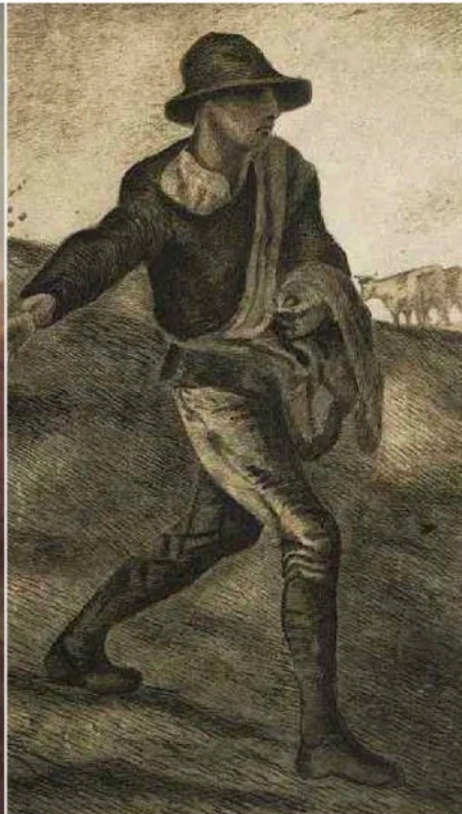
LEGISLADORES DE MÉXICO