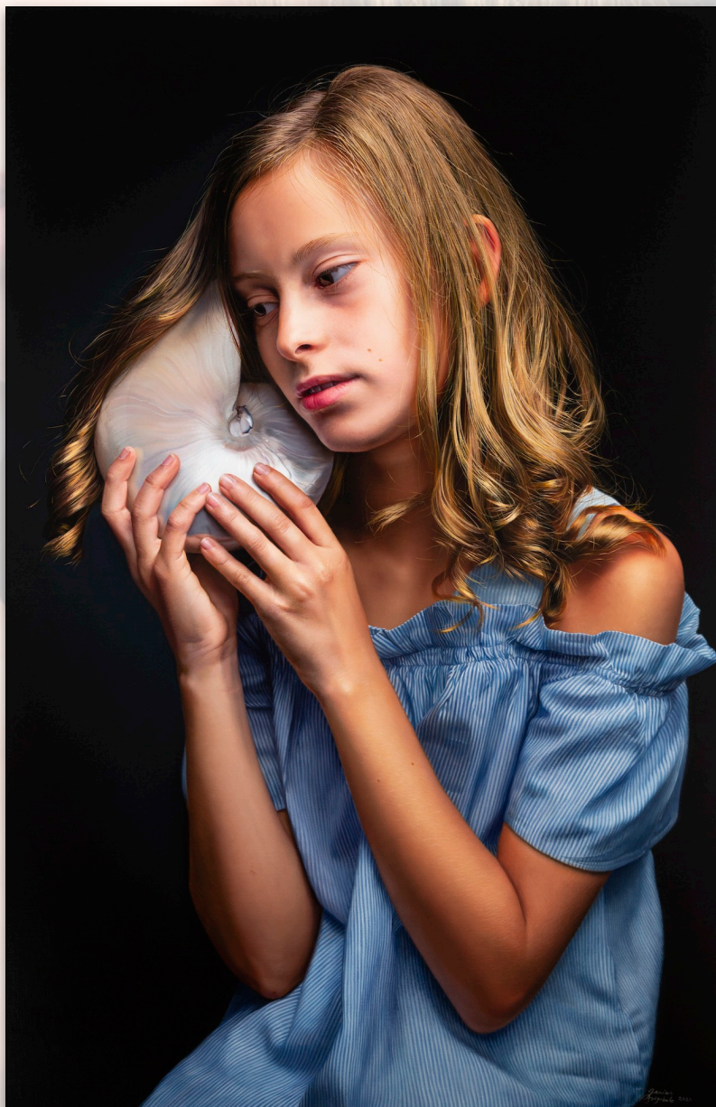
Ane , Feb. 2020, Oil on Canvas, 92 x 60 cm, "Ane" Sessions, "Children" Series © Javier Arizabalo