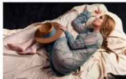
"Un producto cultural probablemente sólo tiene valor para quien sabe apreciarlo y está ligado, también, a sus emociones".