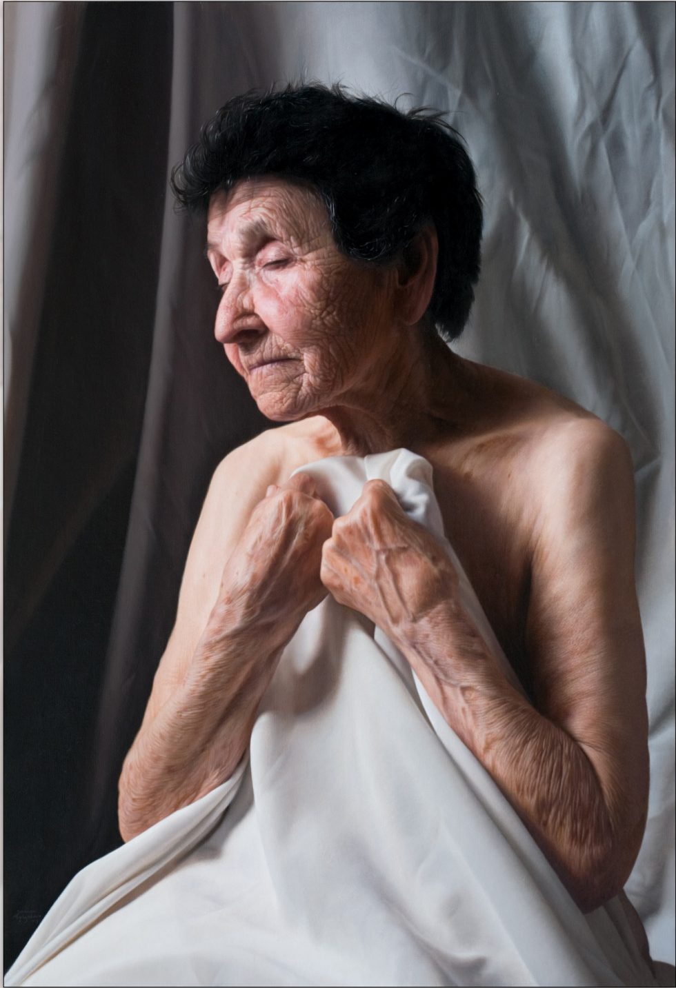
Cristina , Mar. 2010, Oil on Canvas, 73 x 55 cm, "Cristina" Sessions, "Women" Series © Javier Arizabalo