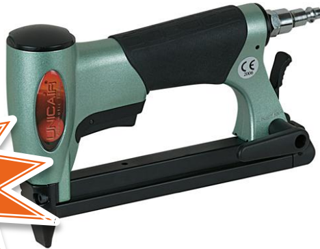
Grappadora NOVA 71/16 TIPO 71