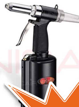
Remachadora RN-901 2,4-4,8 MM