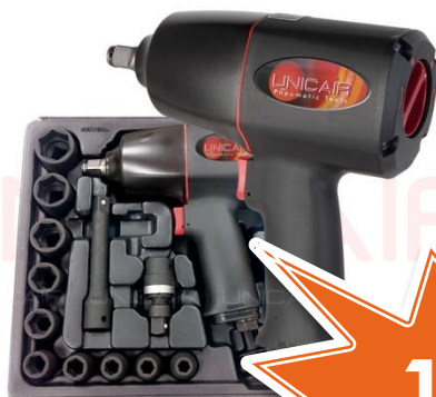
Llave de impacto LLI-434 KIT ½ M-16