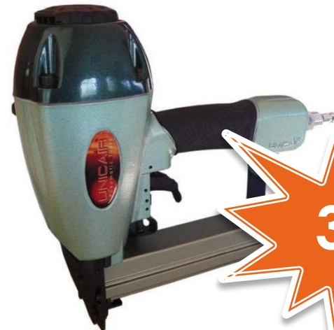
Grappadora NOVA CF/15 TIPO CF