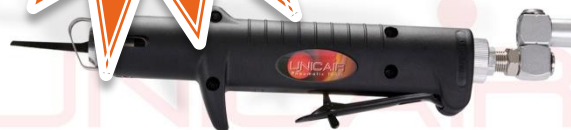
Sierra de sable SS-831/3 CAP. DE CORTE 3MM