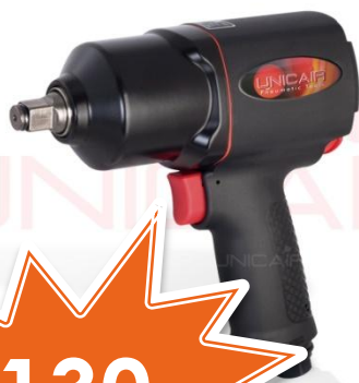
Llave de impacto LLI-413 RV ½ M-16