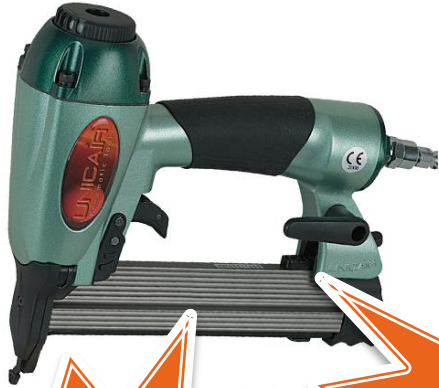
Grapadora NOVA 90/30 TIPO 90