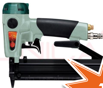
Clavadora NOVA 8/30 0,82MM