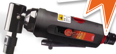
Amoladora angular AA-525-V PINZA 6MM