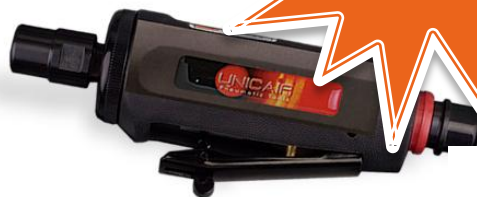
Amoladora recta AR-535-V PINZA 6MM