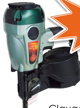
Clavadora MINI TN/40 MIX CLAVOS ACERO 1,8MM