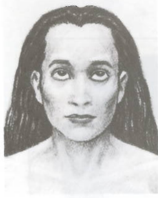
श्री श्री महावतार बाबाजी श्री श्री लाहिड़ी महाशय के गुरुदेव