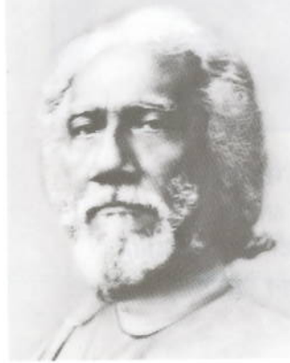
श्री श्री स्वामी श्रीयुक्तेश्वर गिरिजी श्री श्री परमहंस योगानन्दजी के गुरुदेव