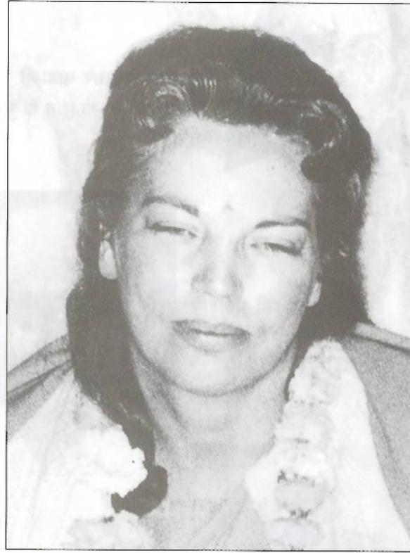
श्री श्री दया माताजी संघमाता एवं अध्यक्ष, योगदा सत्संग सोसाईटी ऑफ़ इण्डिया/ सेल्फ-रियलाइज़ेशन फ़ेलोशिप