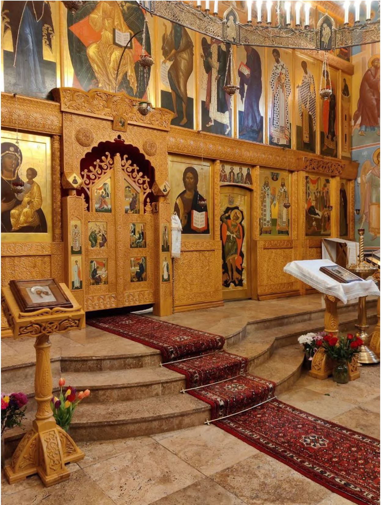
Солея – возвышение, на котором стоит иконостас.