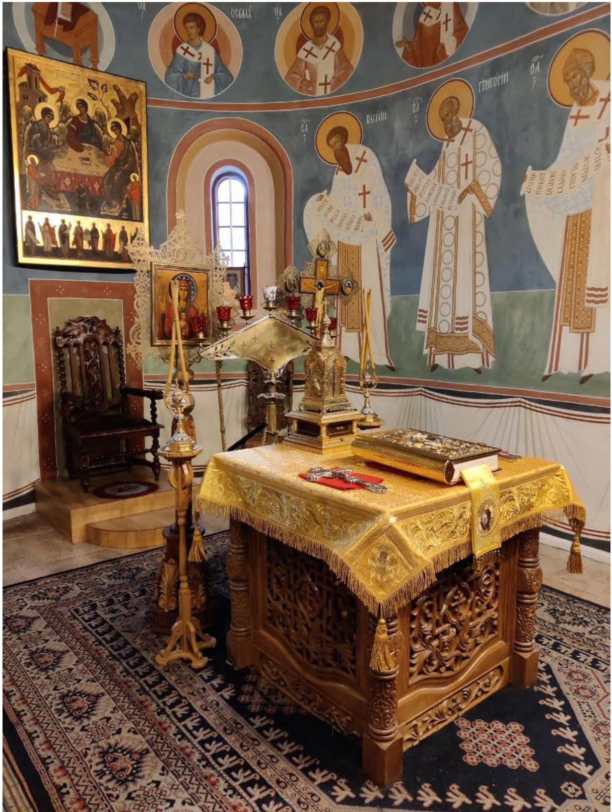
Престол. Мы видим его когда во время Богослужения открываются Царские врата.