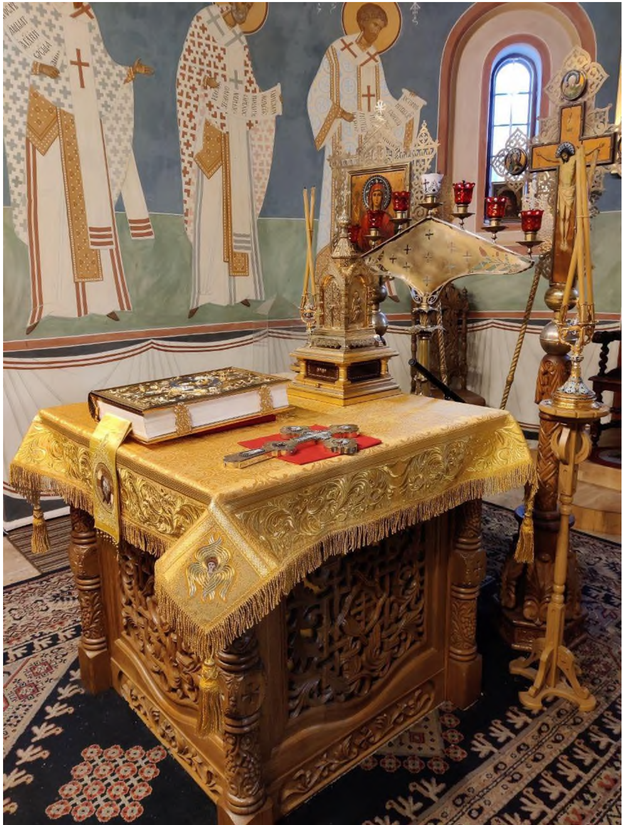
На Престоле находятся Богослужбное Евангелие, Крест и Дарохранительница.