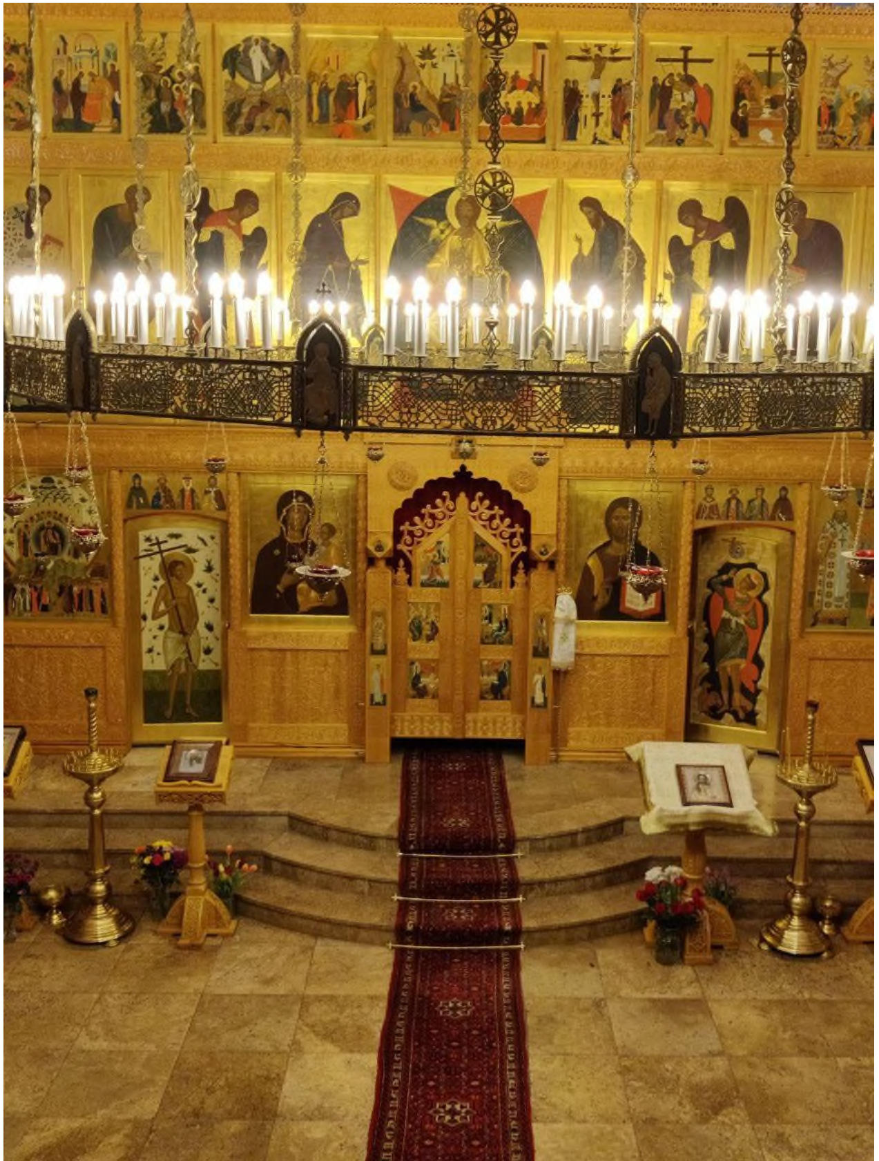
Царские врата. Ступени амвона ведут к Царским вратам, они находятся в центре иконостаса. С обеих сторон от Царских врат находятся диаконские двери.