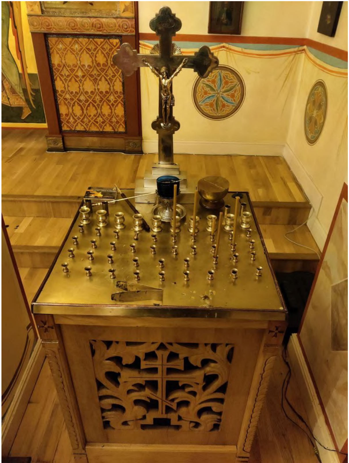
Канунник или канун – четырёхугольный стол с Распятием, на который ставят свечи и молятся об упокоении усопших (умерших людей).