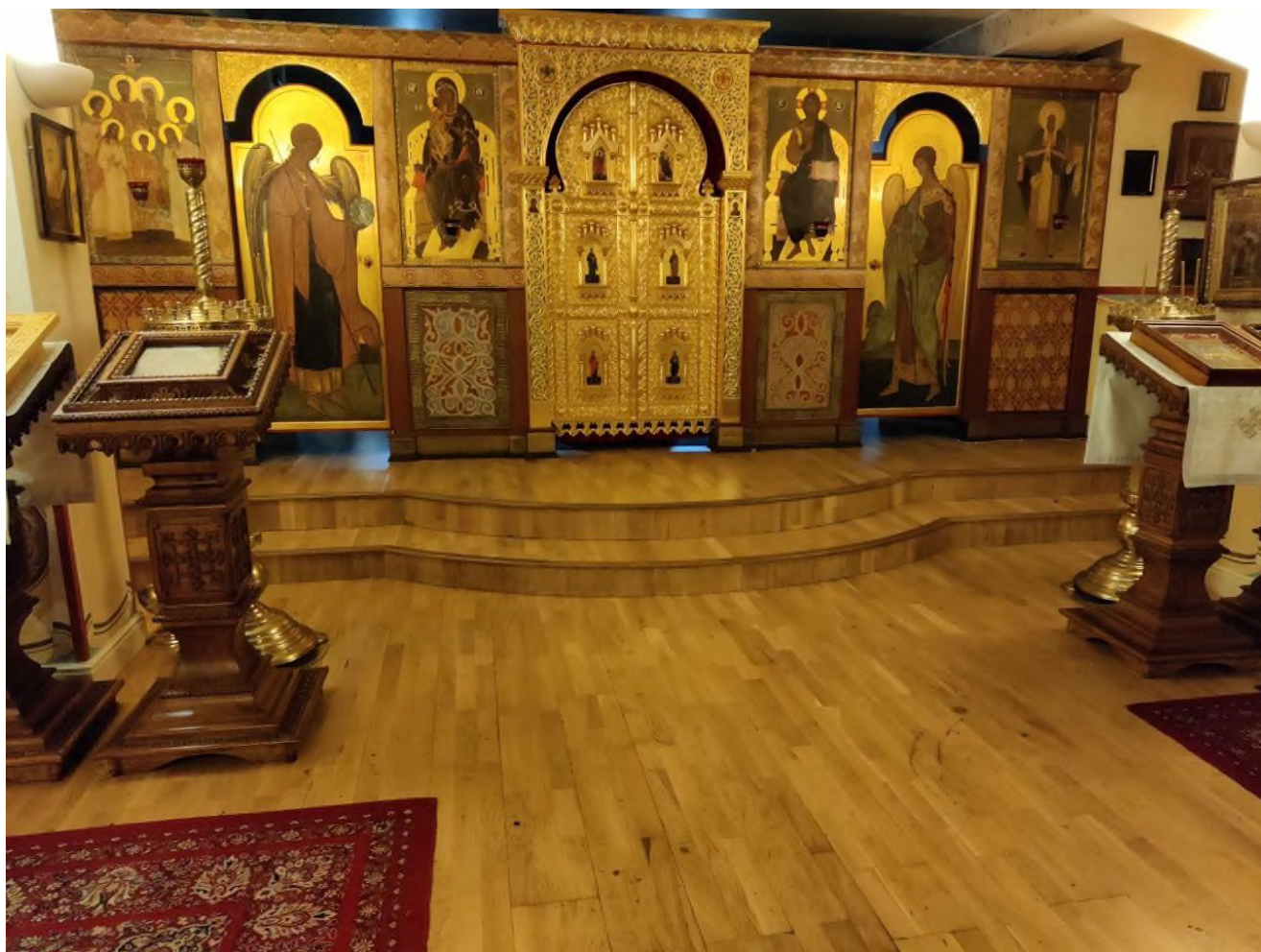
Иконостас. За иконостасом находится алтарь. В алтаре прямо за Царскими вратами находится Престол.