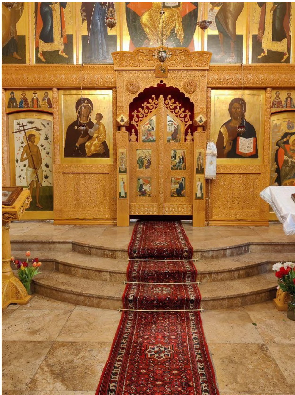
Амвон – выступающая вперёд закруглённая часть солеи.