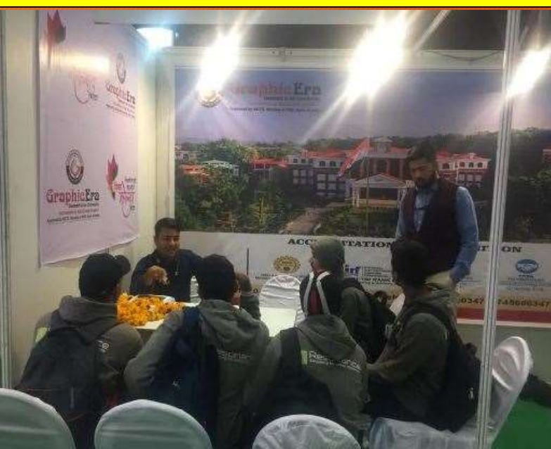
Graphic Era Uni @ Shiksha Mahotsav