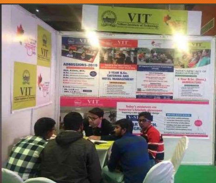
VIT Vellore @ Shiksha Mahotsav