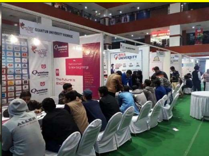
Quantum University @ Shiksha Mahotsav