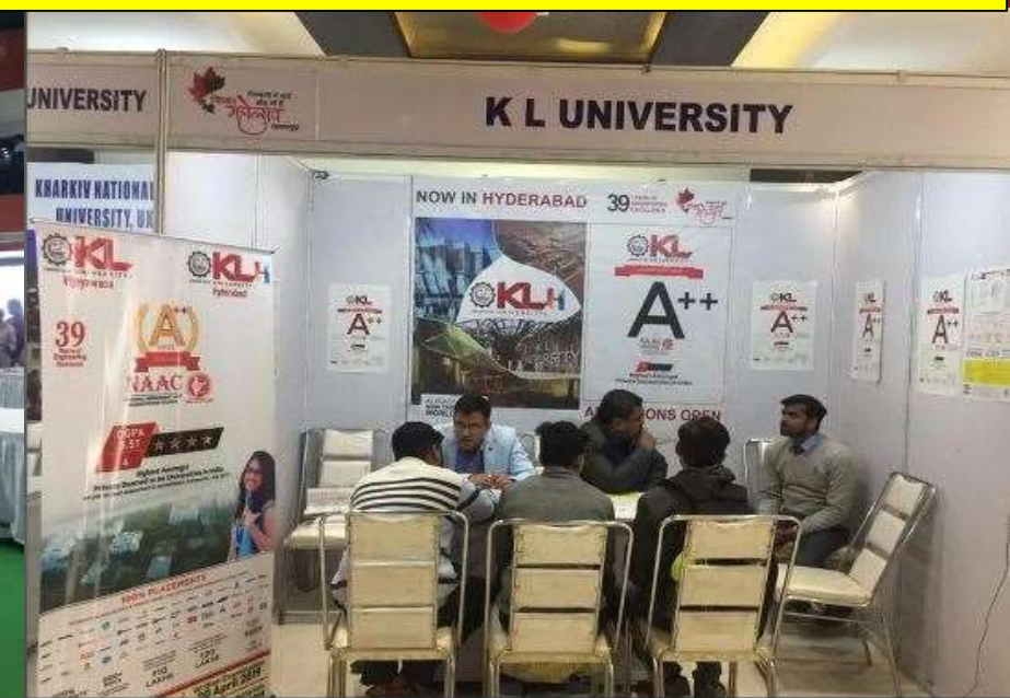
K.L. University @ Shiksha Mahotsav