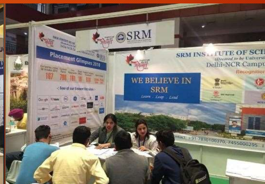
SRM University @ Shiksha Mahotsav