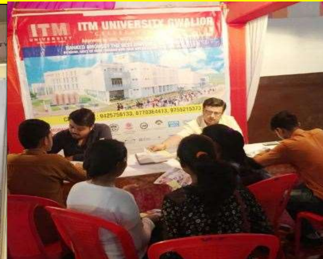
Guest Speaker @Shiksha Mahotsav kharkiv National Medical University ERA Medical Uni @Shiksha Mahotsav ITM University @Shiksha Mahotsav

Shiksha Mahotsav Photos - https://shikshamahotsav.com/photos