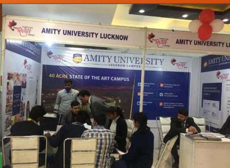
Amity University @ Shiksha Mahotsav