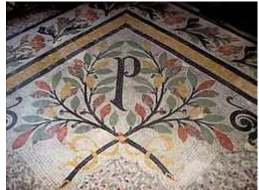
Solado del salón dorado.

Estos son tan solo algunos de los símbolos que podemos encontrar en este edificio, entre muchos otros. El palacio La Prensa, excelente ejemplo de una época de progreso, fue bautizado por George Clemenceau (Notas de viaje por América del Sur; 1911) como “la [obra] más suntuosa de Buenos Aires”, y ella cargada de simbología masónica y mitología antigua, representó un mensaje, un pensamiento que adrede se ha plasmado en sus paredes.