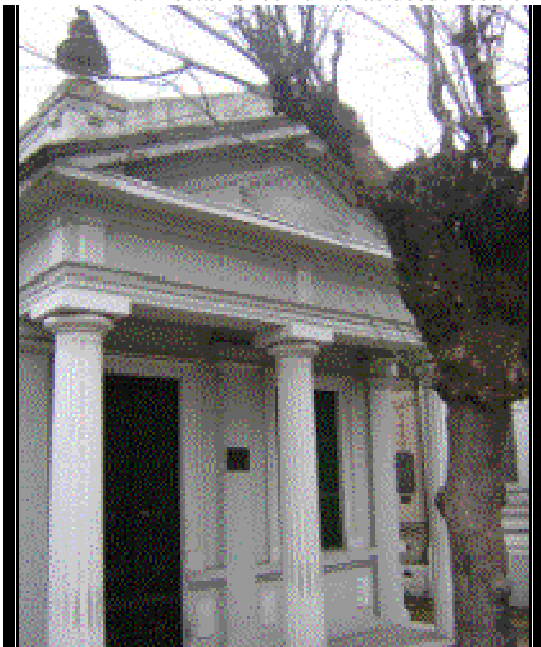
Panteon Liberi Pensatori . Cementerio de la Chacarita

Tal como se desprende del análisis de estas manifestaciones de arte funerario en el Buenos Aires de fines de siglo XIX, el simbolismo ha impregnado todas las manifestaciones humanas desde los tiempos más remotos. 11