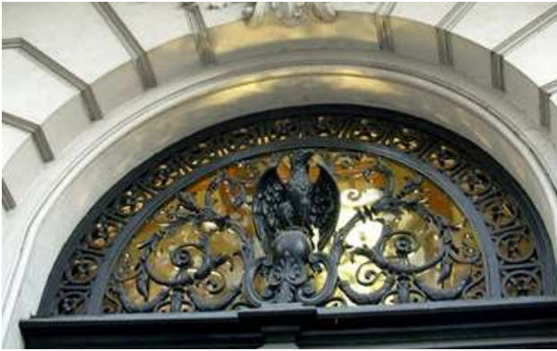
Puerta de acceso principal del palacio principal

Las ventanas del frente están rematadas por la figura de Diana, hija de Júpiter y hermana de Apolo, diosa de la caza. Representada como una mujer de hermosa apariencia, esta imagen se traduce como símbolo de lo luminoso y perfecto.