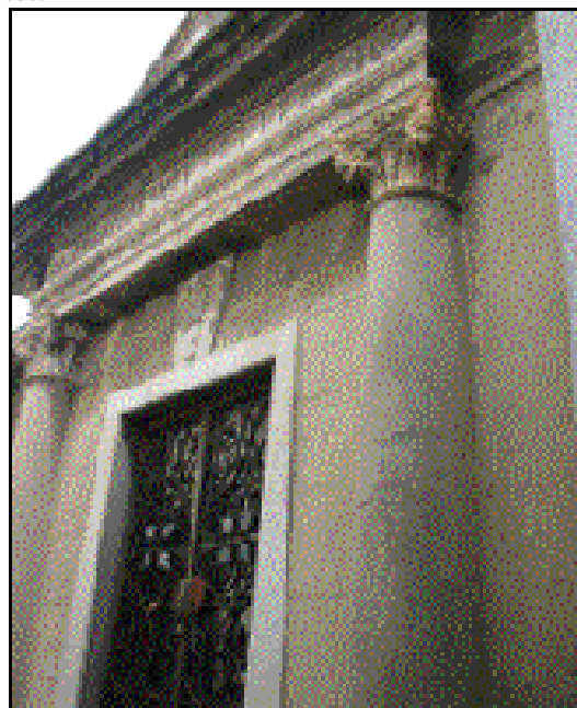
Panteón de la logia "obediencia a la ley" Cementerio de la Recoleta,

La simbología funeraria está fuertemente relacionada con los ritos de las logias masónicas, al punto que la iconografía utilizada en sus templos mortuorios gira indudablemente en la idea de la muerte como "la verdadera vida". Esta simbología es testigo fiel de sus ideales, y mediante esta demuestran seguir hacia otra vida, en donde les espera un proceso de perfeccionamiento y de desarrollo de conocimiento.