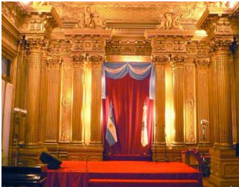
Columnas corintias en el salón dorado.