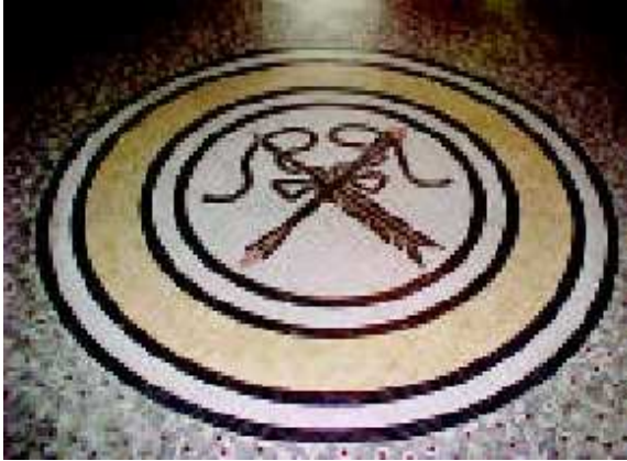
Lazo místico en el hall principal.