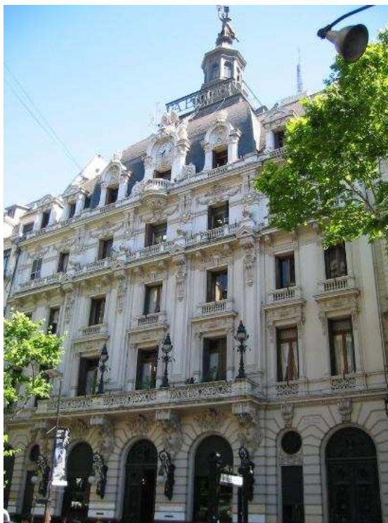
Fachada del edificio La Prensa.

Los masones nacen, luego de su iniciación, como hombres de luz, y esta expresión se ajusta al denominado siglo de los Iluministas (hombres iluminados), cuyos personajes eran, en su mayoría, masones. 10