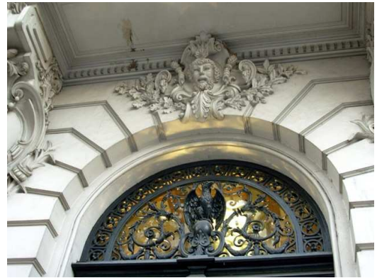
Imagen de Dionisos en el acceso

Ya adentrados en el hall principal del edificio, se encuentran distintos tipos de decoraciones en solados y paredes. Por ejemplo, en el piso del hall hallamos la representación del “Lazo místico”, símbolo de la unión de la fraternidad masónica mediante un vínculo inviolable. Este símbolo, de carácter sagrado, es un lazo de unión entre los masones, por eso se llaman “Hermanos del lazo místico”. Se lo representa también con una cadena que se extiende por toda la tierra.