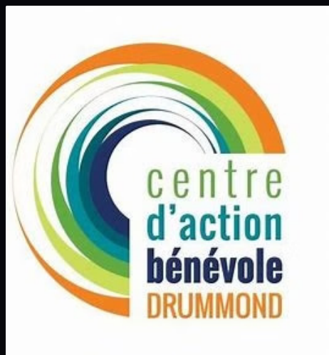
Centre d'action bénévole

Services complémentaires d'autres organismes privés et communautaires :