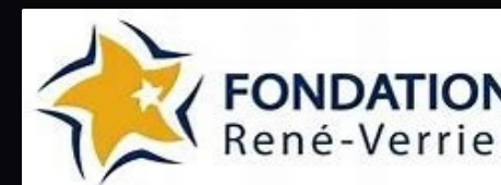
Fondation René Verrier