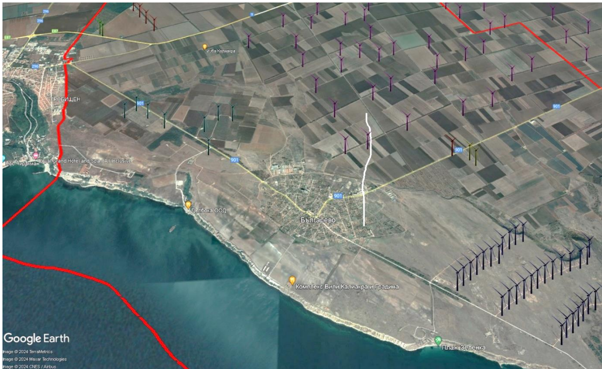
Фигура 2. Ято от 42 големи белочели гъски (бяло), регистрирано през периода на мониторинг през зима 2023-2024 г. в територията на ИСЗП.

Едно ято гъски беше наблюдавано и регистрирано (Фигура 2). Поради липсата на зимуващи гъски през тази зима не беше възможен пространствен анализ.