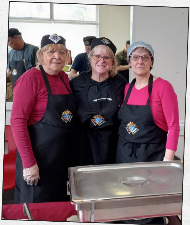
EXCELLENT SERVICE MERCI À VOUS