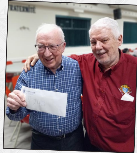
BIEN HEUREUX DU RÉSULTAT