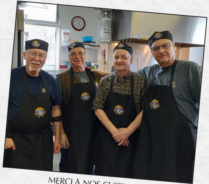
MERCI À NOS CUISINIERS