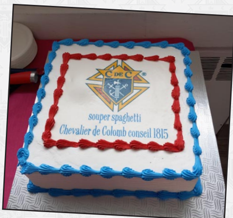
MAUVAIS CONSEIL MAIS BON GÂTEAU