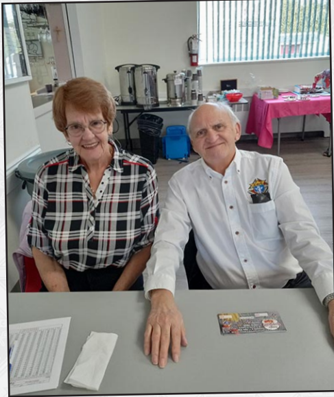
MERCI POUR VOTRE ACCUEIL