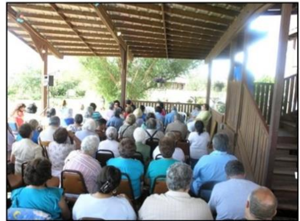
en y Únete a nosotros mientras celebramos la fiesta de nuestra madre de la asunción

Para más información visite nuestro sitio web en www.flameofmercy.com