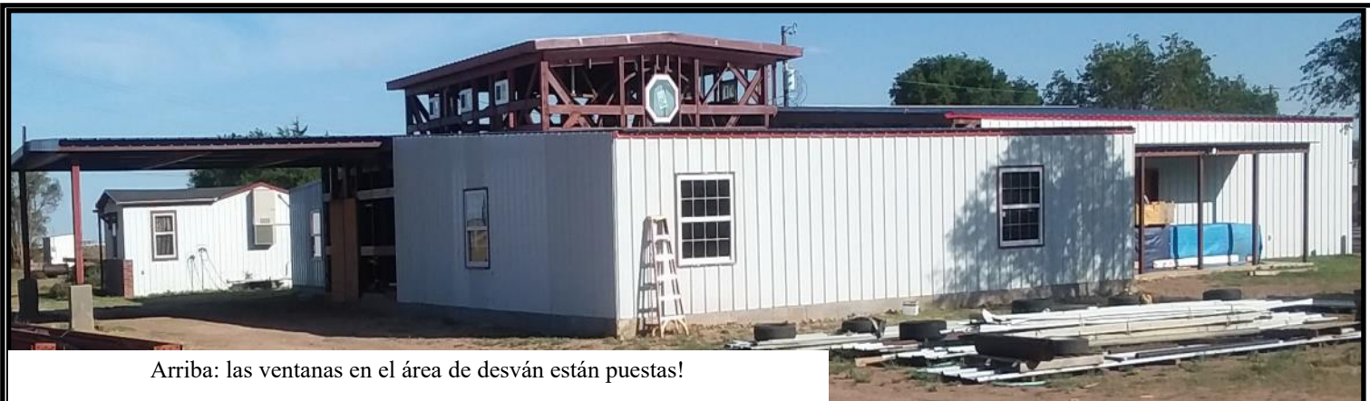
Arriba: las ventanas en el área de desván están puestas!