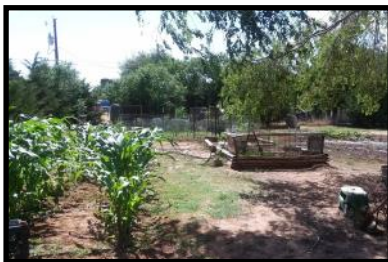
Cultivos de verano en crecimiento