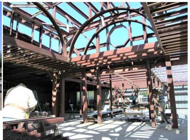
(Arriba) Vista del interior de la capilla que es dos niveles y con capacidad para 64 personas.