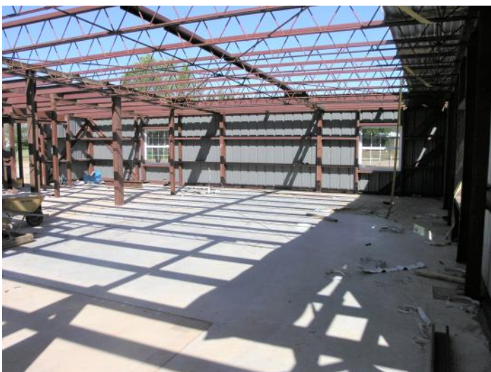
La tienda de regalos espera la instalación del techo.