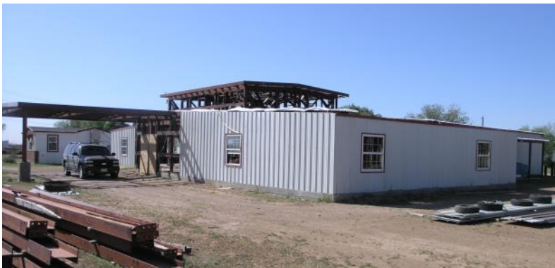
El revestimiento en la sección inferior del edificio está casi completo.