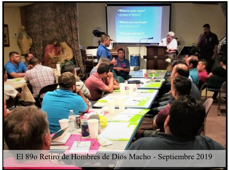
El 89o Retiro de Hombres de Dios Macho - Septiembre 2019

Regístrese hoy en línea: www.flameofmercy.com , correo electrónico: Admin@flameofmercy.com ,