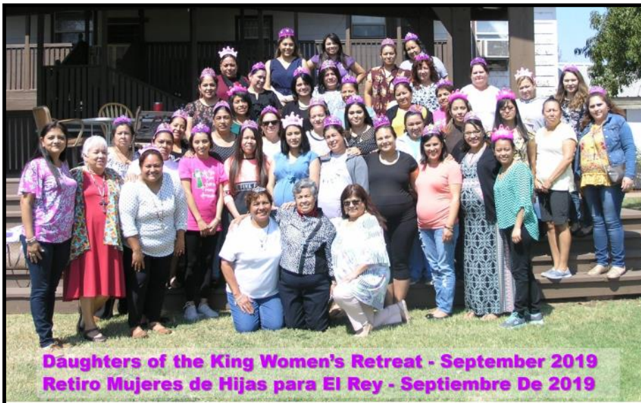
Daughters of the King Women's Retreat - September 2019 Retiro Mujeres de Hijas para El Rey - Septiembre De 2019