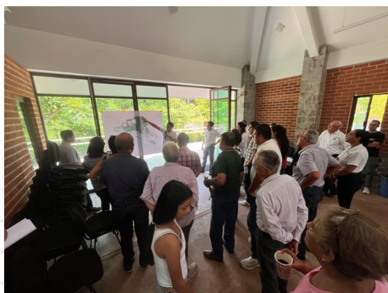
Actividad 4. "Próximos Pasos"