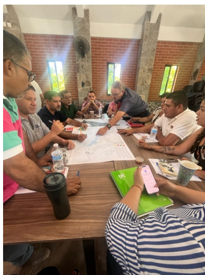
Actividad 3 "Reconociendo los Problemas de nuestra Subcuenca"