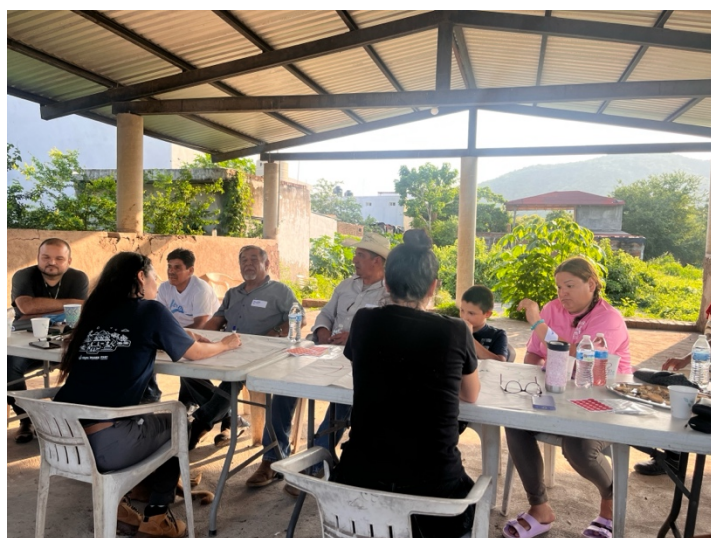
Actividad 4 Mapeo Social