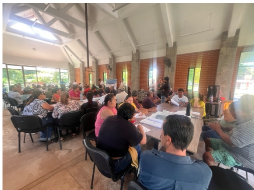
Actividad 3 "Reconociendo los Problemas de nuestra Subcuenca"