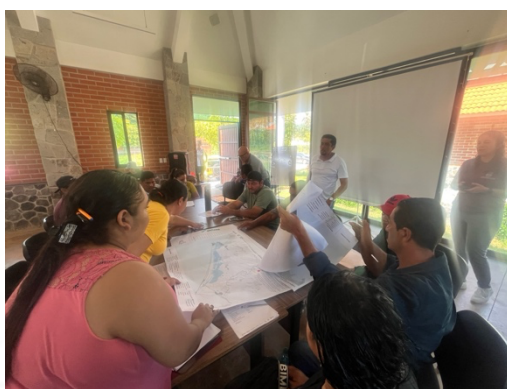
Actividad 4. "Próximos Pasos"