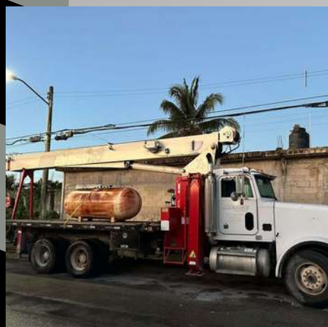
Titan Peterbilt 23Ton