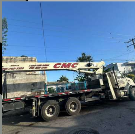
Titan National 23.5Ton