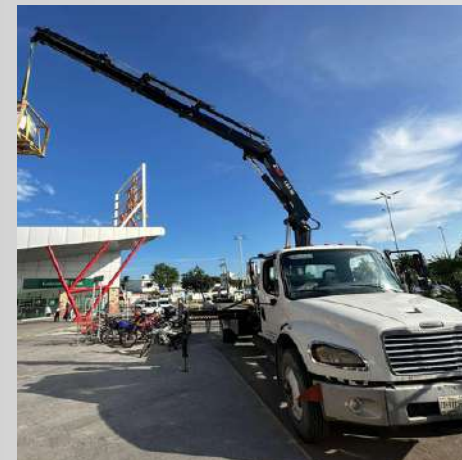
Hiab X-CLX-143 6Ton