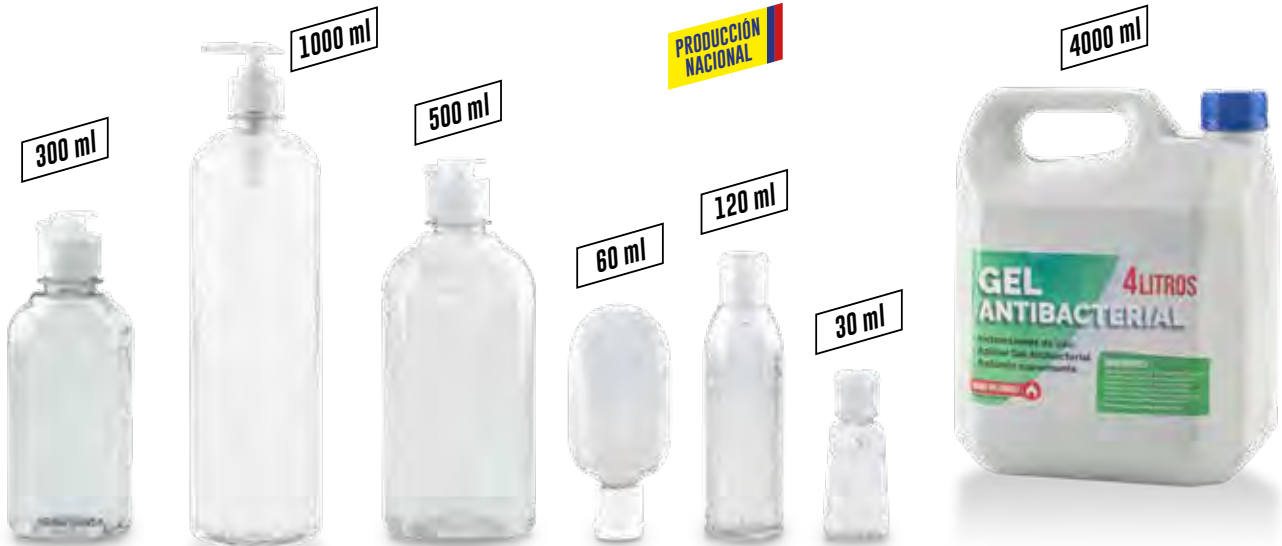
30ml: Disponible en Producción Nacional CP-126