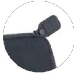
Cierre seguridad Slider magnético