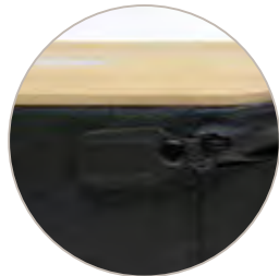
Cierre seguridad Slider magnético