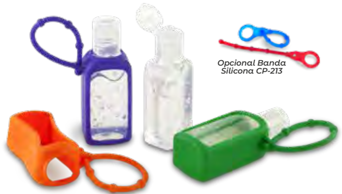
Opcional Banda Silicona CP-213

Medidas: 9 cm x 3 cm diámetro inferior Marca: 2 cm / Tampografía