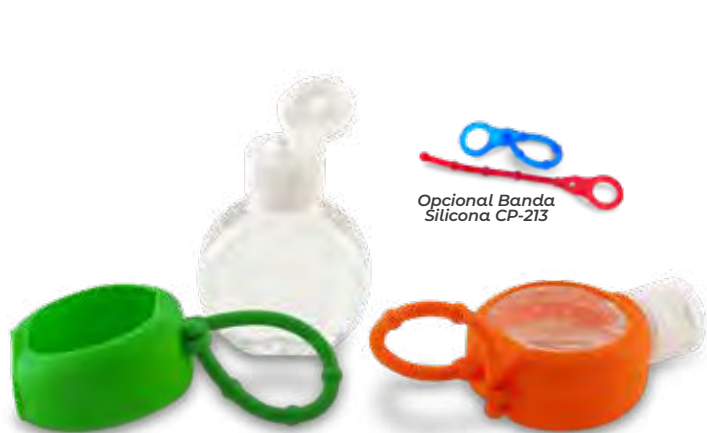
Opcional Banda Silicona CP-213