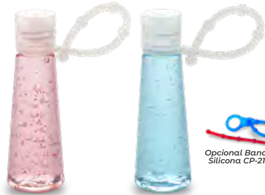
Opcional Banda Silicona CP-213

Medidas: 8 cm x 3 cm diámetro inferior Marca: 2 cm / Tampografía