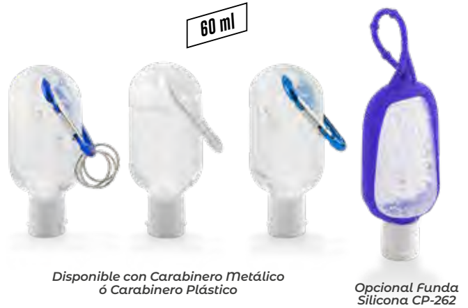
Disponible con Carabinero Metálico ó Carabinero Plástico

Medidas: 60ml: 11.5 cm X 5.2 cm 120ml: 14 cm X 3.8 cm diámetro 300ml: 16 cm X 6.2 cm X 4.7 cm 500ml: 18.5 cm X 7.5 cm X 5.5 cm 1000ml: 23.5 cm X 9.3 cm X 7.5 cm 4000ml: 24 cm X 19 cm X 13 cm Marca: 5 cm / Tampografía / Litografía (Cotización especial) Marca 4000ml: Sin marca