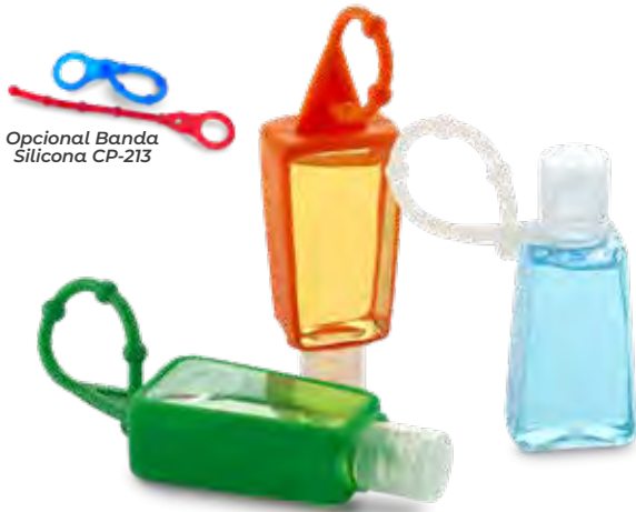
Opcional Banda Silicona CP-213