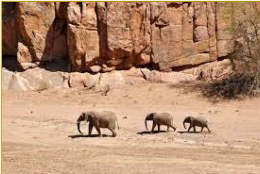
Den Wüstenelefanten auf der Spur – Damaraland- Namibia