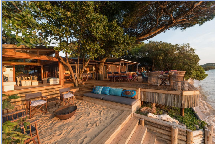
Abschalten in einer privaten Villa mit eigenem Boot - Mozambique