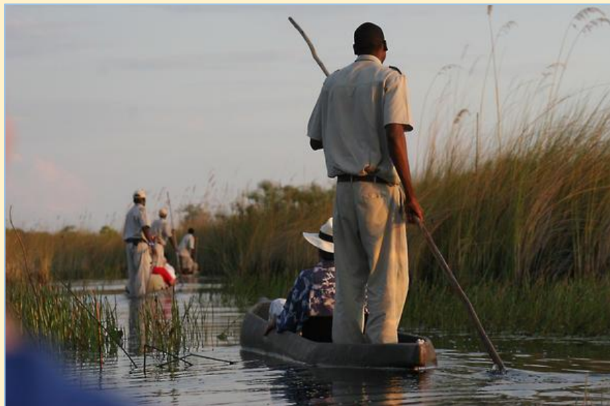
Mokoro Safari – Okavango Delta - Botswana