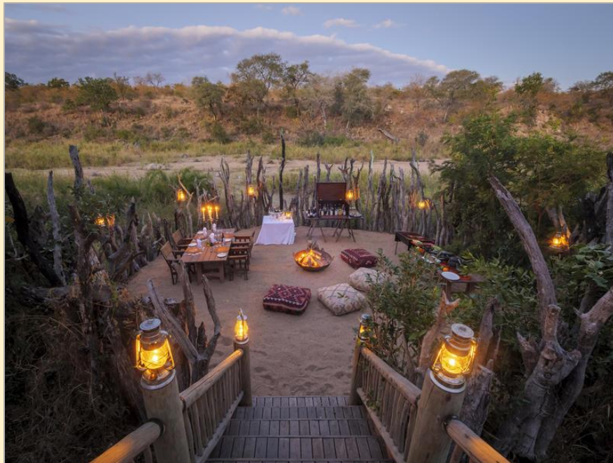
Lasst Afrika in euer Blut – Exklusive Villa - Kruger Park