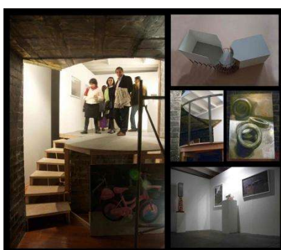
Presentación del Puno-Moca en la galería Lucía de la Puente, Lima (2010)

forma en que el espectador debe recorrer los espacios de las instalaciones. En un pseudo manierismo arquitectónico contemporáneo vemos cómo en el LMCC , en la galería Lucía de la Puente en el año 2010 o en el próximo proyecto a realizarse en Art Basel (2011), el visitante debe recorrer los espacios y no cuenta con ningún punto de visión completa: cada uno de los objetos va develándose paulatinamente, al mismo tiempo en que otros se van ocultando.