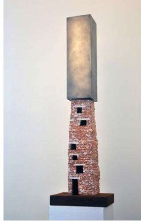
Del Museo de arte Contemporáneo. Cerámica y aluminio (2010)

Estas esculturas no funcionan como maquetas del museo, no son modelos proyectuales para una realización real del Museo, aunque sin embargo no resulta posible desprenderlas de esa referencia a la arquitectura museal contemporánea y a la práctica arquitectónica en sí. Si Frank Gehry ha sido considerado como "el genial escultor de maquetas a escala humana" y si a través de la incorporación de sistemas informáticos ha posibilitado trasladar a la realización arquitectónica formas escultóricas, Cornejo invierte este proceso, la escultura permanece como mera reflexión, imposible de realizarse. La relación entre los distintos materiales, la sensación de completa inestabilidad en las esculturas, representan formas de tensión, de oposición, que clausuran la posibilidad de su realización.