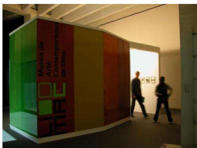
Presentación del Limac en el Musac (2005)

No se realiza una reproducción exacta ni una maqueta de la arquitectura, pero sí son reconocibles los elementos paradigmáticos de este museo: el manejo del color en la fachada y la estructura de sus formas básicas. El espectador encuentra que la arquitectura del Musac, acreedora de grandes premios como el Mies van der Rohe, es tácticamente reutilizada por el museo de la periferia. El museo como objeto simula ser un "apéndice, una extensión, o un tumor" al interior del museo como espacio.