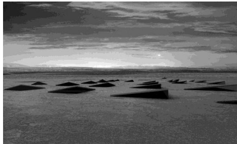
Vista exterior del proyecto Limac. Estudio Productora (2006)

realiza excavando bajo la tierra, utilizando pequeñas aberturas sobre el terreno para el aprovechamiento de la luz y la ventilación.