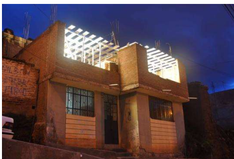
Intervención Puno-Moca en la ciudad de Puno (2011)

En este momento, es interesante la referencia que aparece por el mismo artista al libro El Elogio de la Sombra (1933), de Junichiro Tanizaki. Lo que allí se narra no es sólo la inadecuación de tecnologías occidentales en el Japón sino fundamentalmente los desfases que se generan en la superposición de materiales en el contexto japonés. Lejos de un esencialismo material , Cornejo superpone una construcción que funciona como una crítica tácticamente periférica al lugar del museo dentro de los procesos de transformación urbana. Ese sentido se profundiza en la presentación del aluminio, material sumamente representativo de la producción industrial moderna, opuesto al paisaje de ladrillo, de construcciones sencillas, en la ciudad de Puno.