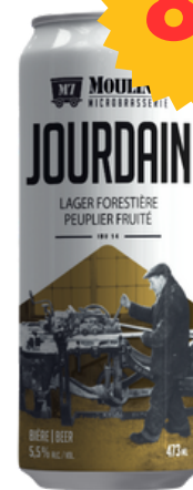
Lager Forestière Peuplier Fruité - IBU 14

En 1927, à la demande du conseil municipal, François Jourdain et ses fils s'installent à Asbestos. Durant plus de six décennies, ils y exploiteront une scierie, une manufacture de portes et fenêtres et autres travaux de menuiserie. Cette lager, à la teinte cuivrée, dégage des arômes boisés! Une gorgée vous rappellera une marche en forêt par une belle journée d'automne.