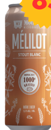
Stout Blanc - IBU 20

En l'honneur de notre millième brassin, la microbrasserie Moulin 7 vous présente une création unique : le Stout Blanc au Mélilot. Laissez-vous charmer par les arômes enivrants de café et de cacao riche, qui s'harmonisent avec des nuances de vanille et une touche subtile de cannelle. Ce breuvage exceptionnel doit son caractère unique à l'ajout soigneux de mélilot, la vanille boréale du Québec,