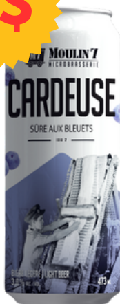
Sûre aux Bleuets - IBU 7

La Cardeuse, Berliner Weiss aux bleuets est un hommage vibrant au travail acharné des femmes du textile de la mine d'Asbestos. Les nuances de bleuet ajoutent une touche de douceur à l'acidité de cette Berliner Weiss, évoquant la délicatesse qui coexistait avec la force des cardeuses.