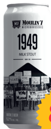
MILK STOUT - IBU 30

Cette bière de couleur noire nous rappelle cette période sombre de la Ville d'Asbestos, la grève de 1949, année de l'une des plus grandes et importantes grèves de l'histoire du Québec. Cette grève a été un épisode clé d'émancipation de la classe ouvrière. Cette Milk Stout, aux arômes de chocolat et de torréfaction, présente un beau côté sucré bien balancé avec la légère amertume du café.