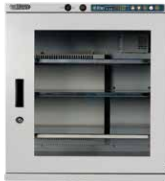
XD1-151-02, Volumen 150ℓ³

Los gabinetes XDry son la solución ideal para almacenar tablillas de circuito impreso y componentes sensibles a la humedad.