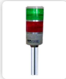
Torre de Luz de Alarma