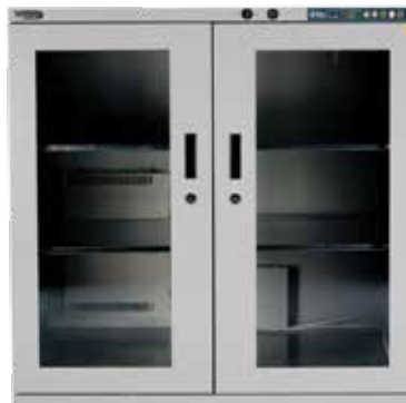
XDx-502-x, Volumen 500ℓ³