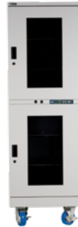
XDx-702-x, Volumen 700ℓ³