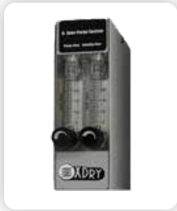
N2 Sistemas Xtra-GAS