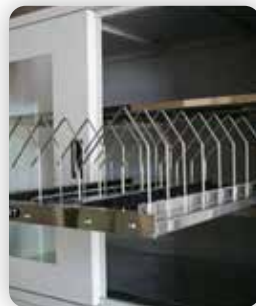
Estante Deslizante de Carretes