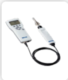
Grabadora de Datos de HR/°C Unidades Grabadoras de Datos de HR/TEMP Certificables a NIST