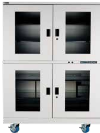
XDx-1104-x, Volumen 1100ℓ³