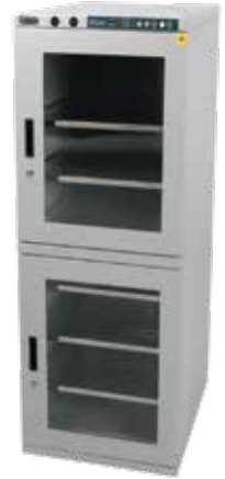
XD1-302-02, Volumen 300ℓ³