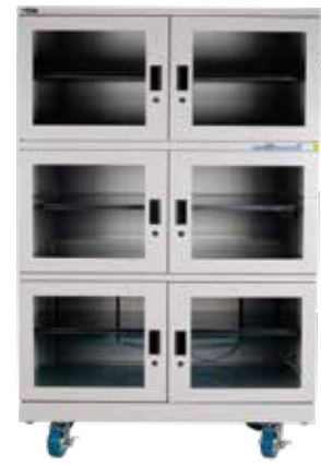
XDx-1106-x, Volumen 1100ℓ³