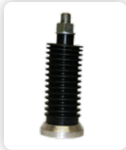
Patatas de Anclaje