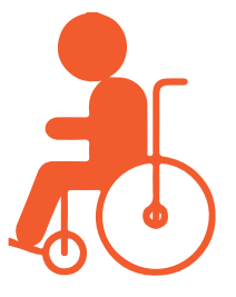
Personas con discapacidades