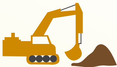
Obras de construcción