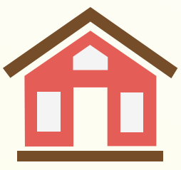
Casas con poco o sin aire acondicionado