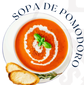
SOPA DE POMODORO