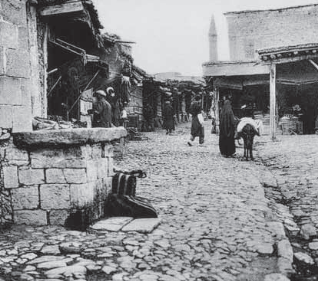
1900'lü yıllarda Harput Sarahatun Camii önünde çarşının genel görünümü

kurtarabildiysek, onlar kurtarıldı, ama yanibaşımızda mesela bir Çınaz Höyük var, Çınaz üç neolitikle ilgili, belki çok daha ciddi araştırılması, kazı yapılması, yörede, Elazığ'da yerleşik hayatın başladığı dönemde mimari unsurların nasıl şekillendiğini belki tespit etmek mümkün olacaktır.