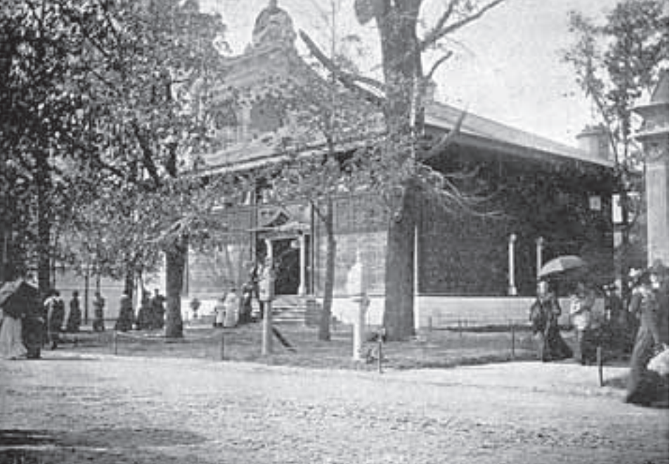
Jackson Park'taki Türk pavyonundan bir görünüm