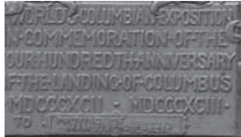
1892 - 1893 Ma'Muretü'l-Aziz'e

Bu arada Mart veya Nisan ayında İstanbul'da bir müzayede evi, Elazığ'la ilgili bir madalya satıyor, satışa çıkartmıştı. Hemen tabii biz mimarlar böyleyizdir, müze yapıyorsak müzeyle ilgiliyizdir, Elazığlıysak Elazığ'la ilgileniriz. Hemen etkilendim ve bu madalyayı alma şansım oldu. İnşallah müzemiz yapılıp bittiğinde müzenin bir eseri olur. Madalya 1893 yılında Amerika'nın 400 yıllık keşfi dolayısıyla Amerika'da yapılan büyük bir sergiden gelen madalya. Kolombiya Dünya Sergisi bu, buraya Türkiye Osmanlı devleti olarak davet edilmiş. Osmanlı Abdülhamit dönemi bu sergiye çok