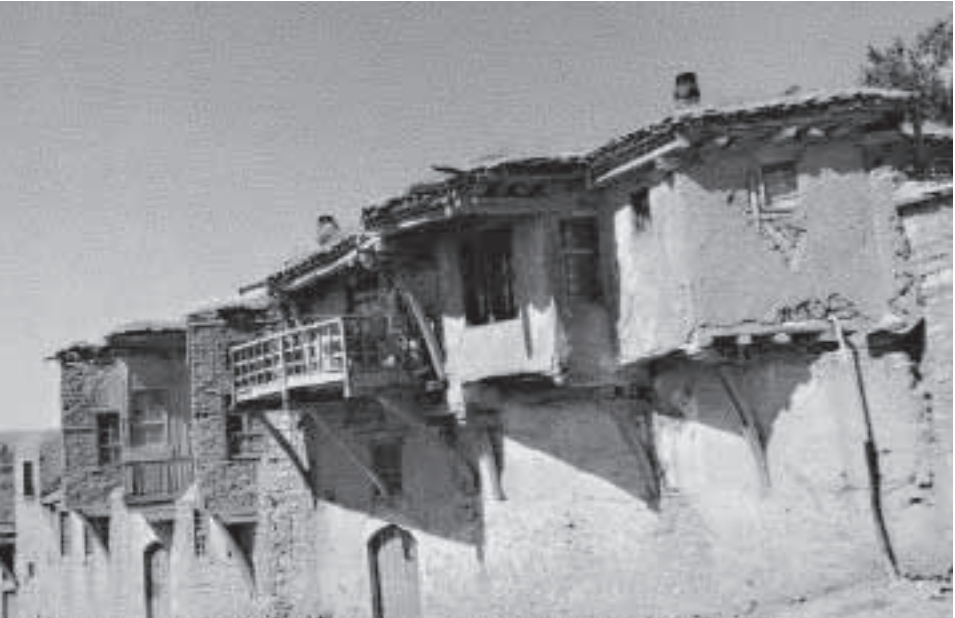
Harput Darkapı girişinden soldaki evler

Harput'un demografik gelişimi ve nüfus hareketleri belgelerinde kentin Müslüman nüfusu yanı sıra yoğun Ermeni (Hristiyan) nüfusuna sahip