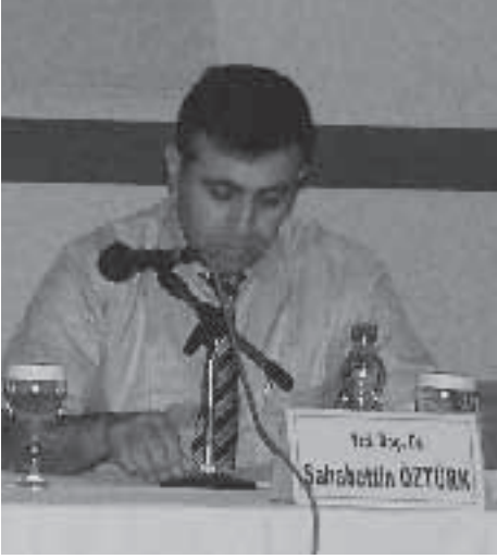
2. Oturum Konuşmaları