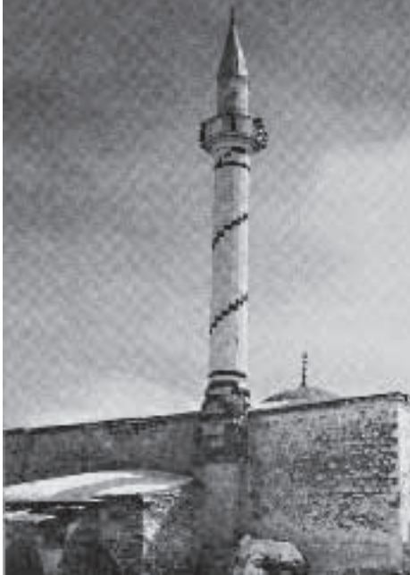
1950'li yıllarda Harput Sarahatun Camii