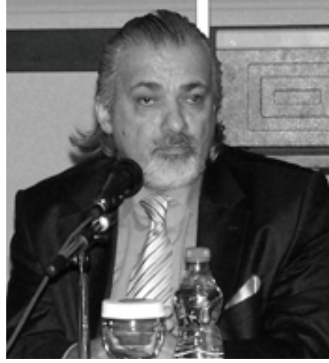
1. Oturum Konuşmaları

OTURUM BAŞKANI- Hocamıza bu değerli bilgilerden dolayı teşekkür ederiz.