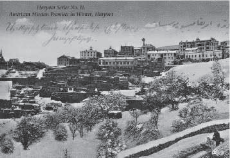
1800'lü yılların sonunda Harput Protlar mahallesindeki Amerikan Okulları (Fırat Koleji)'nin görünümü

Kuşattığı Menbiç Kalesinde atılan bir okun isabetiyle 6 Mayıs 1124'te genç yaşta ölen ve Halep'te Hz. İbrahim Makamı'na gömülen bu Artuklu kahramanı için, Battalname,