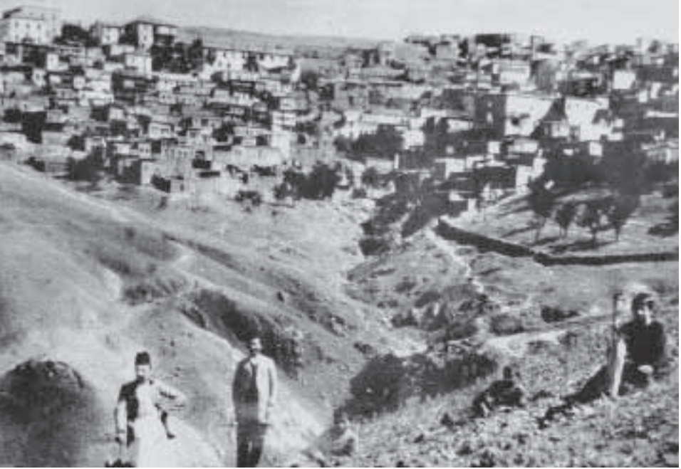
1900’lü yıllarda Harput’tan bir görünüm

Avanos onarılmaya çalışıldı. Akşehir’de Rıfki Hocamızın mektubu var, bütün tarihi mezar taşlarını yok edildiğini yazmışlar, o da oturmuş Ankara’ya bir yakınına mektup yazmış. Oğlu bana getirdi bütün mektuplarını, diyor ki, “Yok ediyor adamlar kültürel mirasımızı, bunlar bizim ata yadigarı.”