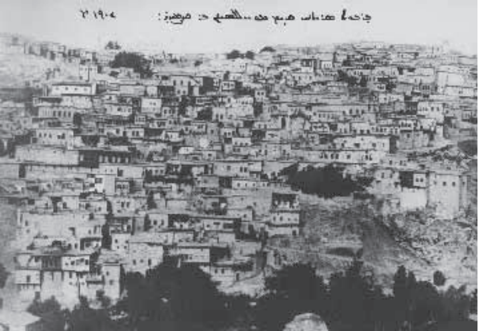
1902'de Harput Sarahatun ve Gürcübey Mahallesi