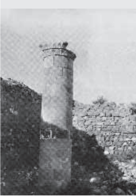
1950'li yıllarda kale içindeki Camii kalıntısı