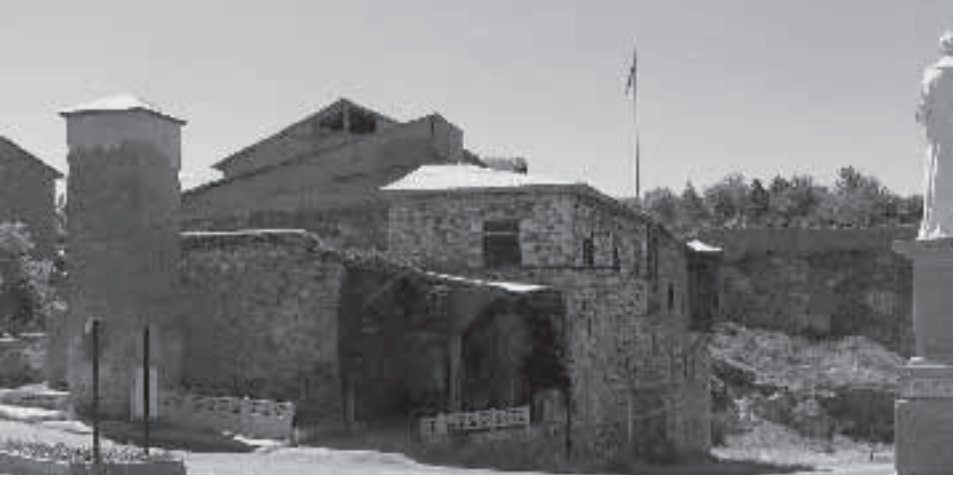
Sağır Müftü Konağı

mimarisinde karşımıza çıkmaktadır. Benim araştırmamda, gayrimüslim ve Müslümanların kullandığı konut planı dış görünüm itibarıyla herhangi bir farklılık yoktur.