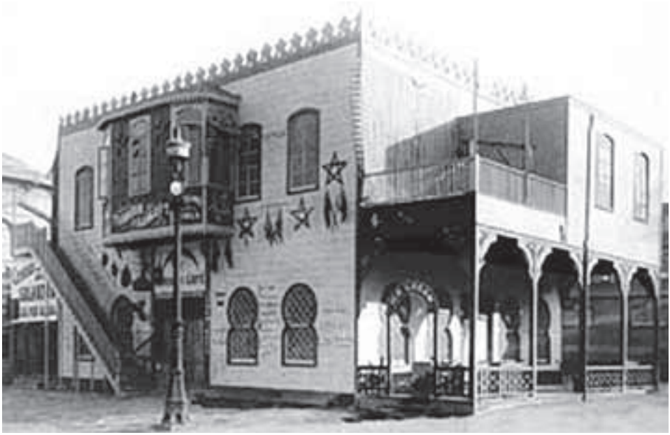
Sergide kurulan Türk kahvehanesi