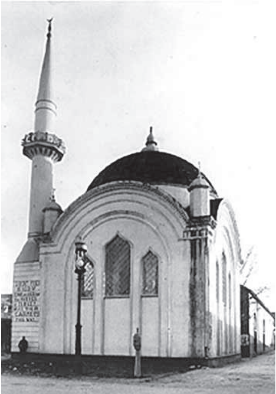
Sergide kurulan Türk Camii'si