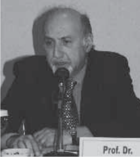
1. Oturum Konuşmaları