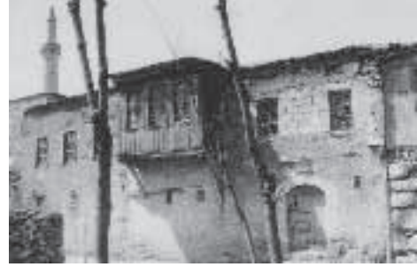
1970'li yıllarda Harput Ağa Camii ve çevresindeki evler

Harput aynı durumda değil. Çok doğru söyledi dostum, Harput'ta arkeolojik alan olarak alacağız, bu haritaların üzerine oturtacağız, hamam, cami, han her mahallenin merkezini oluşturan handı, hamamdı, çarşı bölgesiyle ilişkilerini kuracağız ve arkeolojik alana alacağız. Cumhuriyet Türkiye'sinin bu çirkin yapılarının nerede yapılmayacağını göstereceğiz ve onların da yıkılması için de başvuruda bulunup, her yıl bir kat indirelim, sonunda kaybedelim