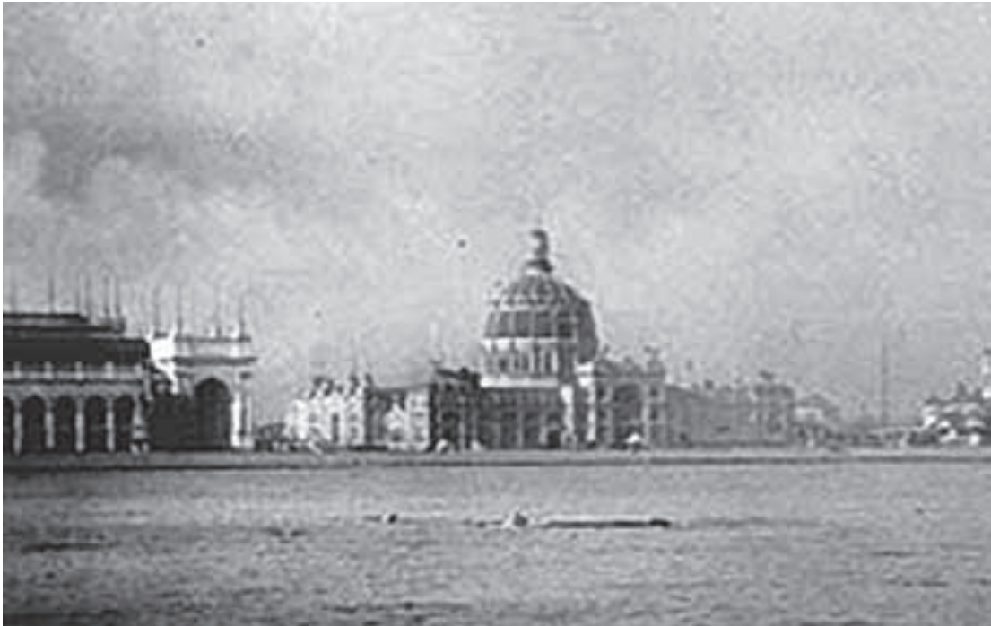
Fuar alanından genel görünüm