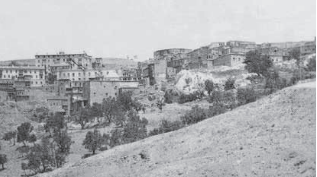
1800'lü yılların sonuna doğru Amerikan Okulları'nın güney'den görünümü

Özellikle 1950'li yıllardan bu yana kentlerimizdeki doğal, tarihsel ve kültürel değerleri olumsuz etkileyen, onların nitelik yitirmesine ve hatta yokolmasına neden olan hızlı ve çarpık