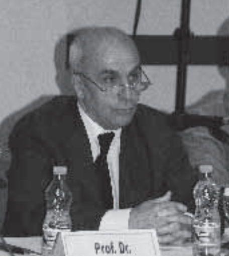
1. Oturum Konuşmaları