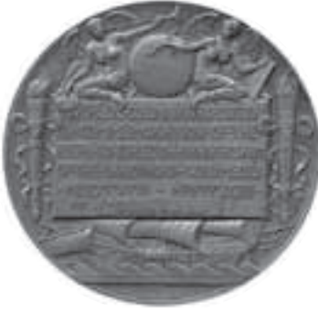
Ma'Muretü'l-Aziz'e verilen madalya

bilgilerin toplandığı bir alan yarattık. Bunun sol tarafındaki yerde de küçük bir okuma odamız var. Bu binanın küçük bir bodrumu var, orayı da tamamen restorasyon ve müzeler için gerekli olan konservasyon ve restorasyon merkezleri ve depo olarak kullandık.