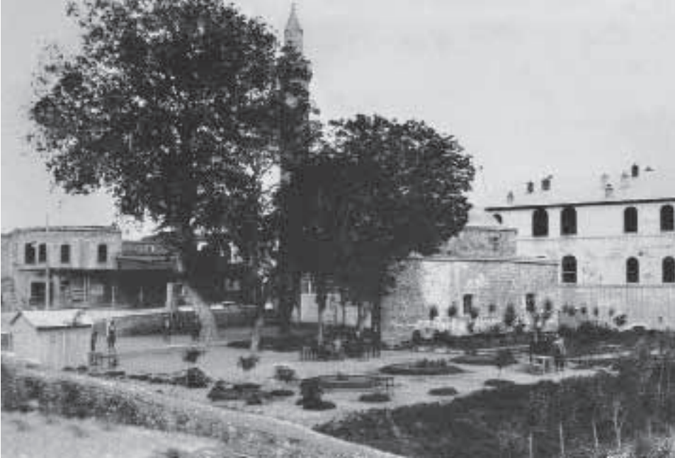
1930'lu yıllarda Harput Kurşunlu Camii ve Hükümet Konağı (Yanan Mektep) civarı

Dabakhane Deresi ve Dabakhane su kaynakları