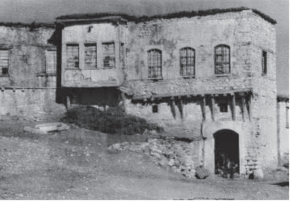
1970'li yıllarda Ağa Camii yanındaki konak