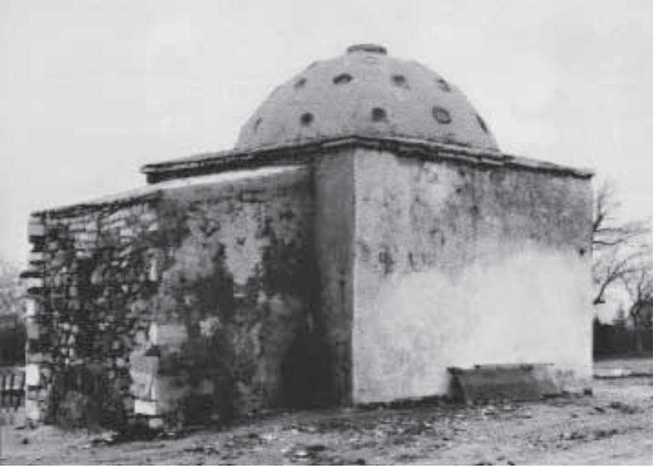
1950'li yıllarda Harput yolu üzerindeki Hitit Hamamı

bu kadar öneriler ortaya atılıyorsa, bu elbette ki bir başlangıç olarak çok güzel sonuçlarını getirir. Tabii benim konu Ortaçağ Harput'una dair bazı kayıtları değerlendirilmesiydi, ama ben bunun neresini nasıl anlatacağım? Bir özet yapacağım bazı yerlerden ve biraz daha duygusal yönleri, burada da karamsar bir tablo çıkıyor. Maalesef medeniyetlerin beşiği olan bu şehirlerin kaderi aynı insanların kaderi gibidir. İnsanın hayatı nasıl zikzaklıysa, yani bir gün güzel, bir gün morali bozuk, bir gün morali iyiye, şehirlerde de böyle tarih boyunca, eski çağdan günümüze kadar bu manzara böyle gelmiş. Tarihçiler bazılarını kaydetmişler, bazılarını kaydetmemişler. Bazılarını