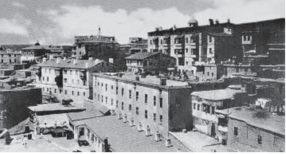
1800'lü yılların sonuna doğru Harput Amerikan Okulları kız bölümü (Fırat Koleji)

yapıldığı sırada terk edilmiş olduğu; mutasarrıf paşanın aşağıda Mezre'de oturduğu söylenebilir. Avludaki dört beş kişinin giyim tarzları ise yirmi yıllık fes ve setre-pantolon yeniliğinin henüz Harput'a ulaşmadığı yorumuna açıktır.