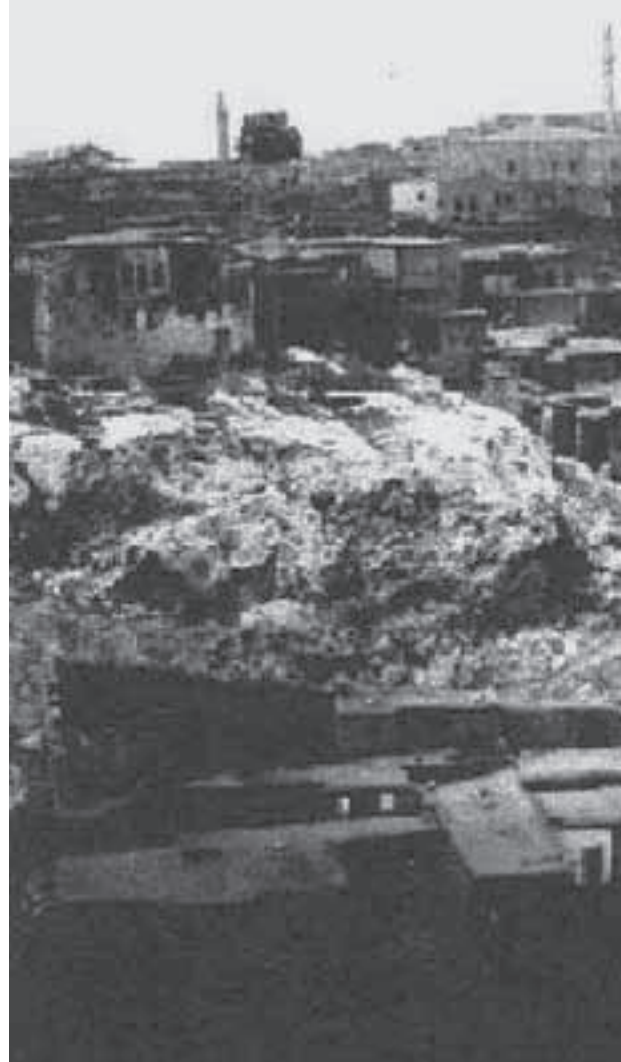
Harput'un kuzey doğudan görünümü