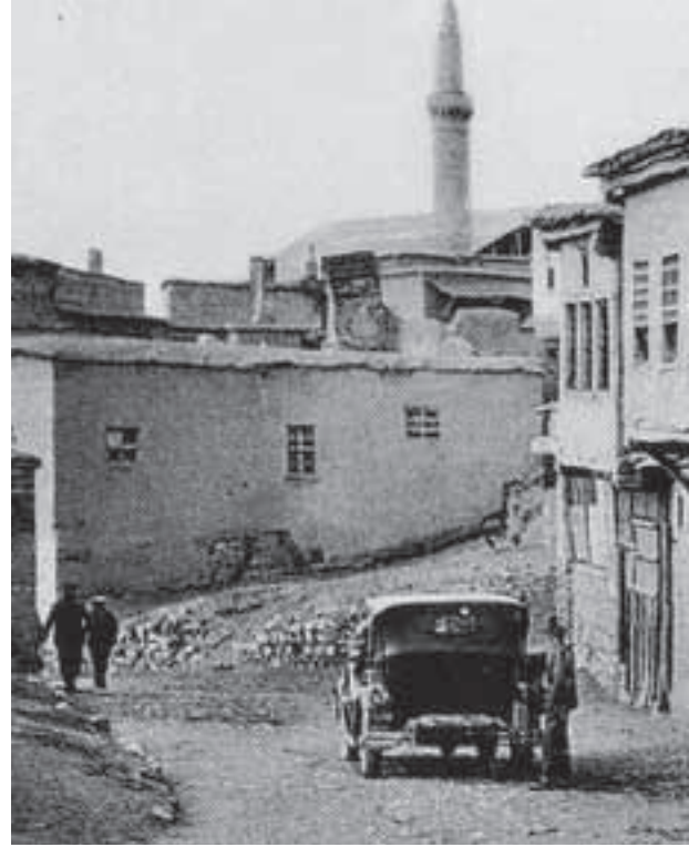
1930’lu yıllarda Kurşuhlu Camii’nden Üç Lüleli çeşmeye inen cadde

değer sorunu olduğunu söylememiz gerekir. Bu konu üzerinde turizmcilerden çok bilim adamları, sanat insanları ve mimarlar duruyor. Fakat bu konunun özünde bir değer sorunu yatıyor. Değerli olduğu için korumaya çalışıyoruz kültür mirasımızı, ya da tarihsel mirasımızı. Ancak bu değerın kendi başına farkına vardıkdan