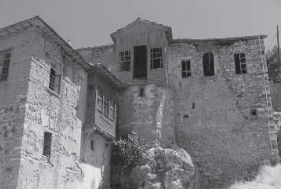
Sağır Müftü Konağı

Konağın inşa kitabesi olmadığından yapım tarihi ve ustası hakkında kesin bir bilgi yoktur. Ancak evi gerçek sahiplerinde öğrenilen bilgiye göre XIX. yüzyılın ortalarında