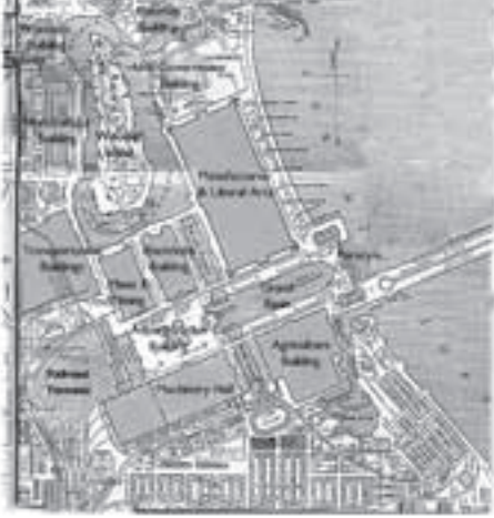
Fuar alanı kısmi planı

önem gösteriyor cami yapıyor, yani o derece büyük bir para harcıyorlar ve bütün Osmanlı veya her birinden