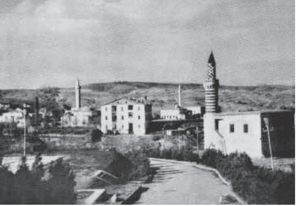
Kayabaşı'ndan Harput'un görünümü