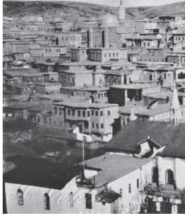
Harput’ta Fransız Mektebi’nin bulunduğu mahalleden bir görünüm

Harput baharı, Harput yazı, Harput güzü, Harput zemherisi... söz gelişi 1892de nasıl yaşanıyordu ise bu hayat sahneleri de kurgulanabilir. Toprak damlı evlerin tandır başlarında, Acem öyküleri, Tâhir ile Zühre, Kerem ile Aslı, Âşık Garip, Battal Gazi okunabilir;