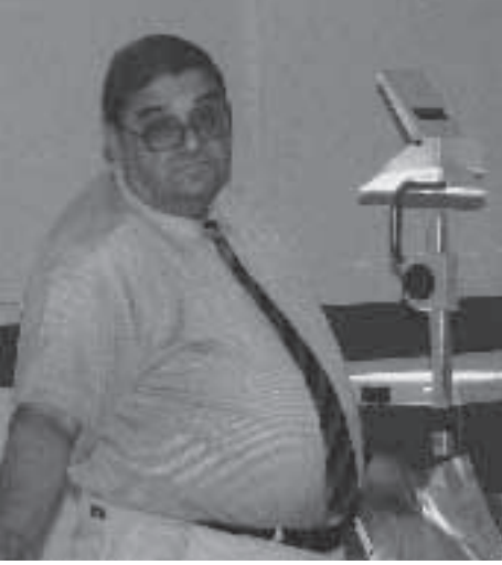
1. Oturum Konuşmaları