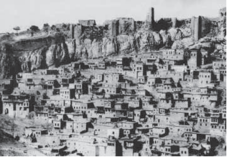
19. yüzyıl başlarında Harput Gürcübey Mahallesi