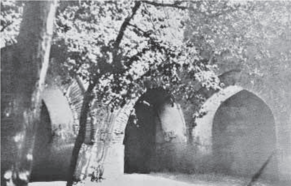
Harput Ulu Camii içerisindeki avlunun restore edilmeden önceki hali