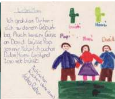
Geburtsgrüsse an Mami