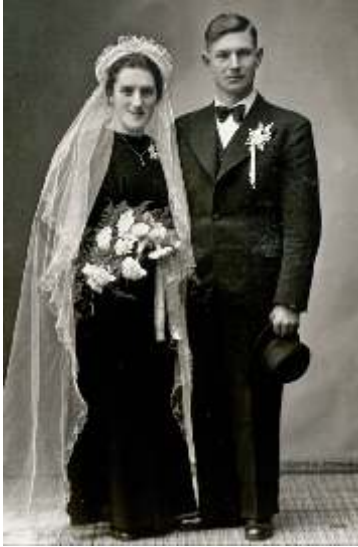
Heirat am 19. Januar 1942