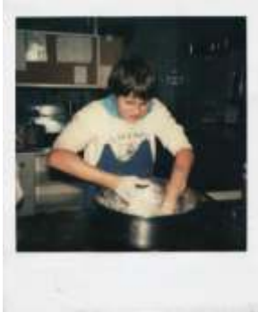
Grittibänz im Cristal