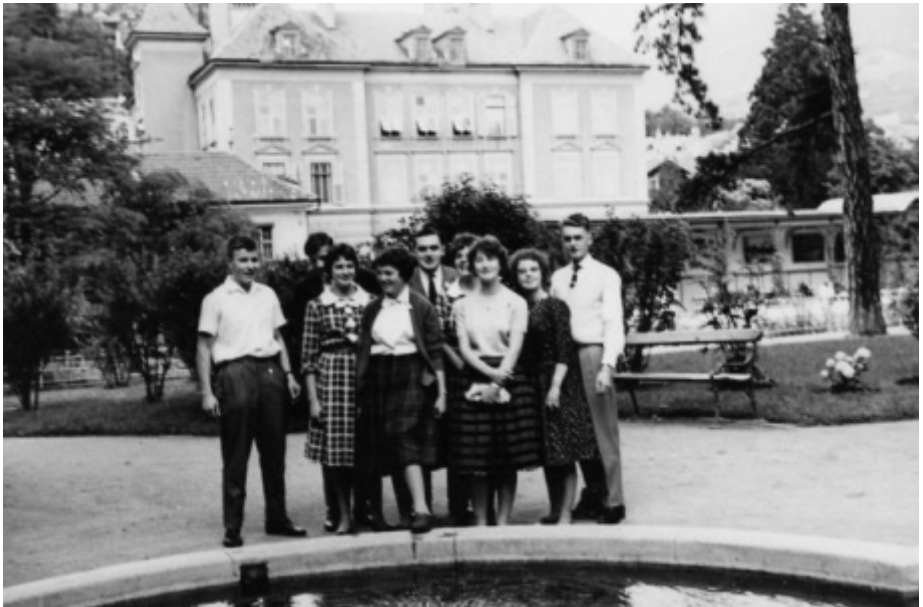
Die „Junge Garde“ des Kirchenchors Seewen auf dem Ausflug nach Bad Ischl

Der Übertritt in den Kirchenchor erfolgte 1957 bei Beginn der Handelsschule im Theresianum. Da mein Berufswunsch "Lehrerin" war, belegte ich 2 Jahre Klavierunterricht im Theresianum, welchen ich aber während der Handelsschule aufgeben musste. Das Pensum wäre zu gross gewesen.