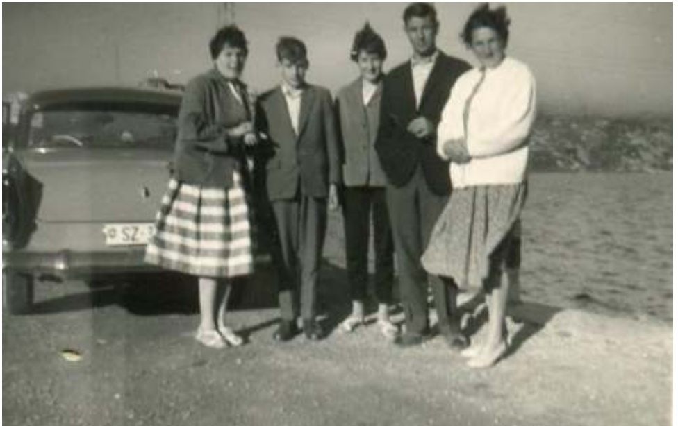
Die ganze Familie auf dem Gotthardpass bei der Fahrt nach Madonna del Sasso

In der Familie soll beginnen, was leuchten soll im Vaterland