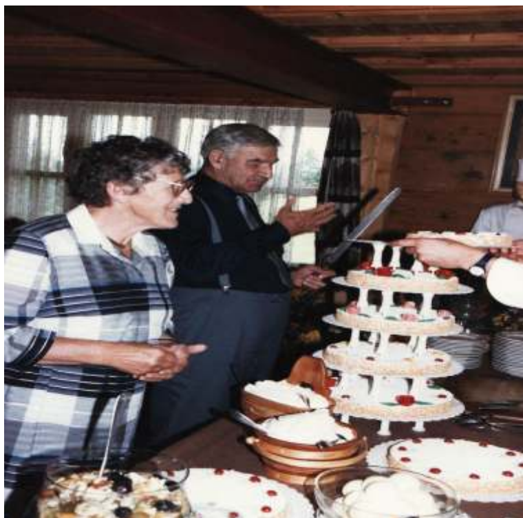
Mutti und Dädi am 70. Geburtstag im Herrenboden