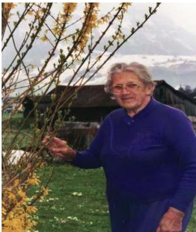
Mutti im Garten an der Steinerstrasse an ihrem 85. Geburtstag

Ihre letzte Arbeitsstelle vor der Heirat war der "Bauernhof" in Sattel, von der sie immer heitere Episoden mit den dort einquartierten Soldaten erzählte.