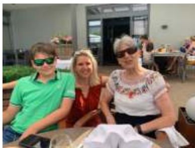
Omas 80. Geburtstag