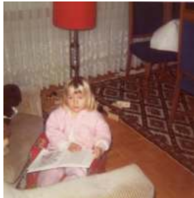
Familienferien, Nesslau Spielzimmer, Steinerstrasse und Herrenboden