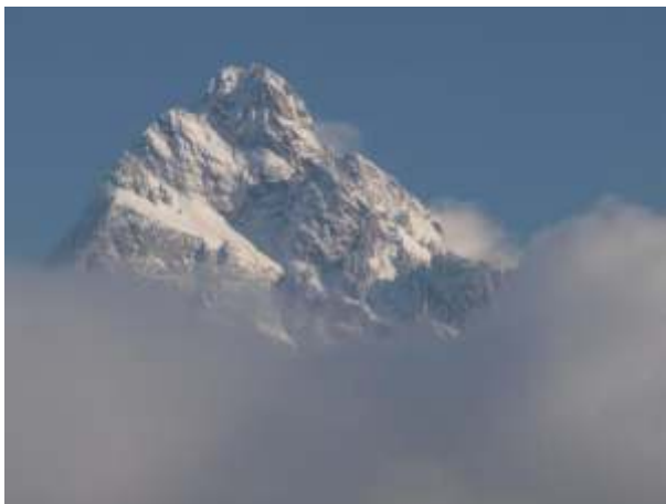
Seewen - am Fuss der Mythen