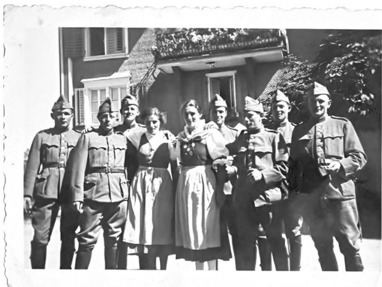
Diensthabende Appenzeller-Soldaten halfen den Bauern von Sattel beim Heuen und tranken im „Bauernhof“ Möschtli, Bier und Kaffee

Hätten wir doch viele solche gute Soldaten, solch gute Mütter und Männer wie General Guisan, der um Mitternacht des 7. April 1960 gestorben, am 12. April zu Grabe geleitet worden und somit in die Ewige Heimat eingegangen ist, nachdem er unserer irdischen Heimat so treu gedient und sie beschützt hat.