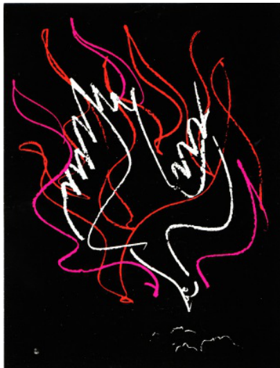
Friedenstaube von Hans Erni

Apostel Paulus an die Epheser 2, 13 – 16