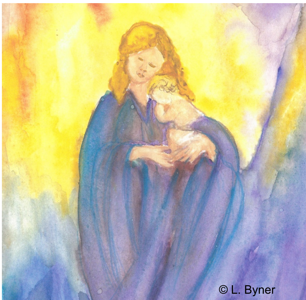
Unsere Liebe Frau von Seewen SZ