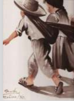
Miteneand geht's besser