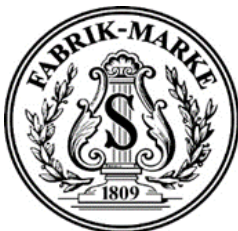
Das richtige 'Schiedmayer S' Logo