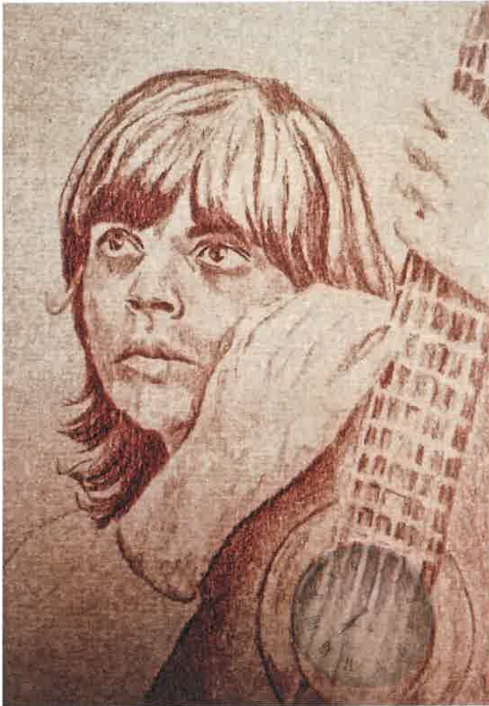
La French Mademoiselle par Ed Illustratrice ©Ed Illustratrice