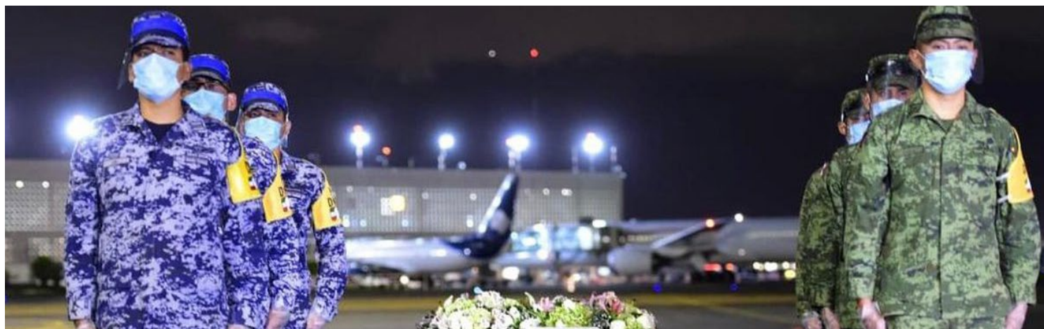
Como «héroes», repatrian urnas de migrantes fallecidos por covid en NY.

Mientras que San Andrés Cholula, Huaquechula, San Miguel Xoxtla, San Diego La Mesa, Tochimilco, San Nicolás de los Ranchos, Nealtican, Juan C. Bonilla, Calpan y Ahuehuetitla, entre otros, recibirán las cenizas de uno de sus pobladores.