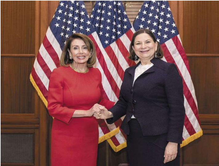
La embajadora de México en Estados Unidos, Martha Bárcena y Nancy Pelosi, vocera de la Casa de Representantes de Estados Unidos