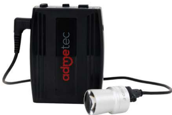
ORCHID / ORCHID-F