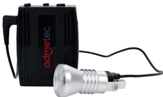
ORCHID-S / ORCHID ERGO

L'éclairage ORCHID est le premier du genre sur le marché mondial. Il se distingue par sa légèreté tout en offrant un éclairage bien focalisé et sans ombre.