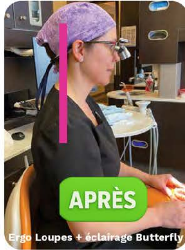
Ergo Loupes + éclairage Butterfly