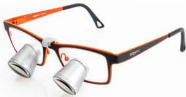
2.5x | JAZZ

Des oculaires galiléens de haute qualité installés dans les loupes sont placés extrêmement près des yeux et offrent ainsi un large champ de vision.