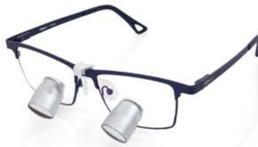
2.7x | INDIE