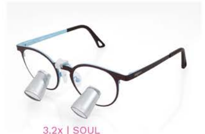
3.2x | SOUL