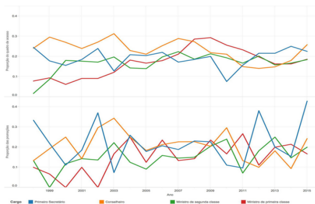
Gráfico 1: Proporção de mulheres nos Quadros de Acesso e nas Promoções de 1998 a 2015.

A igualdade de gênero só pode ser alcançada se as mulheres estiverem representadas de maneira equitativa em todos os níveis da sua carreira profissional. No caso específico do Itamaraty, a proporção de mulheres tende a reduzir-se a patamar menor do que o verificado no ingresso à medida que elas ascendem aos estágios mais elevados da carreira. A extensa pesquisa intitulada “As mulheres na carreira diplomática brasileira: uma análise do ponto de vista da literatura sobre mercado de trabalho e gênero”, por Rogério Farias e Gêssica Carmo, em 2016, aponta para obstáculos ao fluxo de carreira das mulheres diplomatas. A partir da compilação de trinta e quatro listas de quadro de acesso e sua correlação com 1.772 promoções do período de 1998 a 2015, os pesquisadores identificaram um gargalo na ascensão funcional feminina, em particular no estágio de conselheira para ministra de segunda classe. Com exceção do período compreendido entre 2003 e 2009, a proporção de mulheres entre os promovidos a ministro de segunda classe é de 10%.