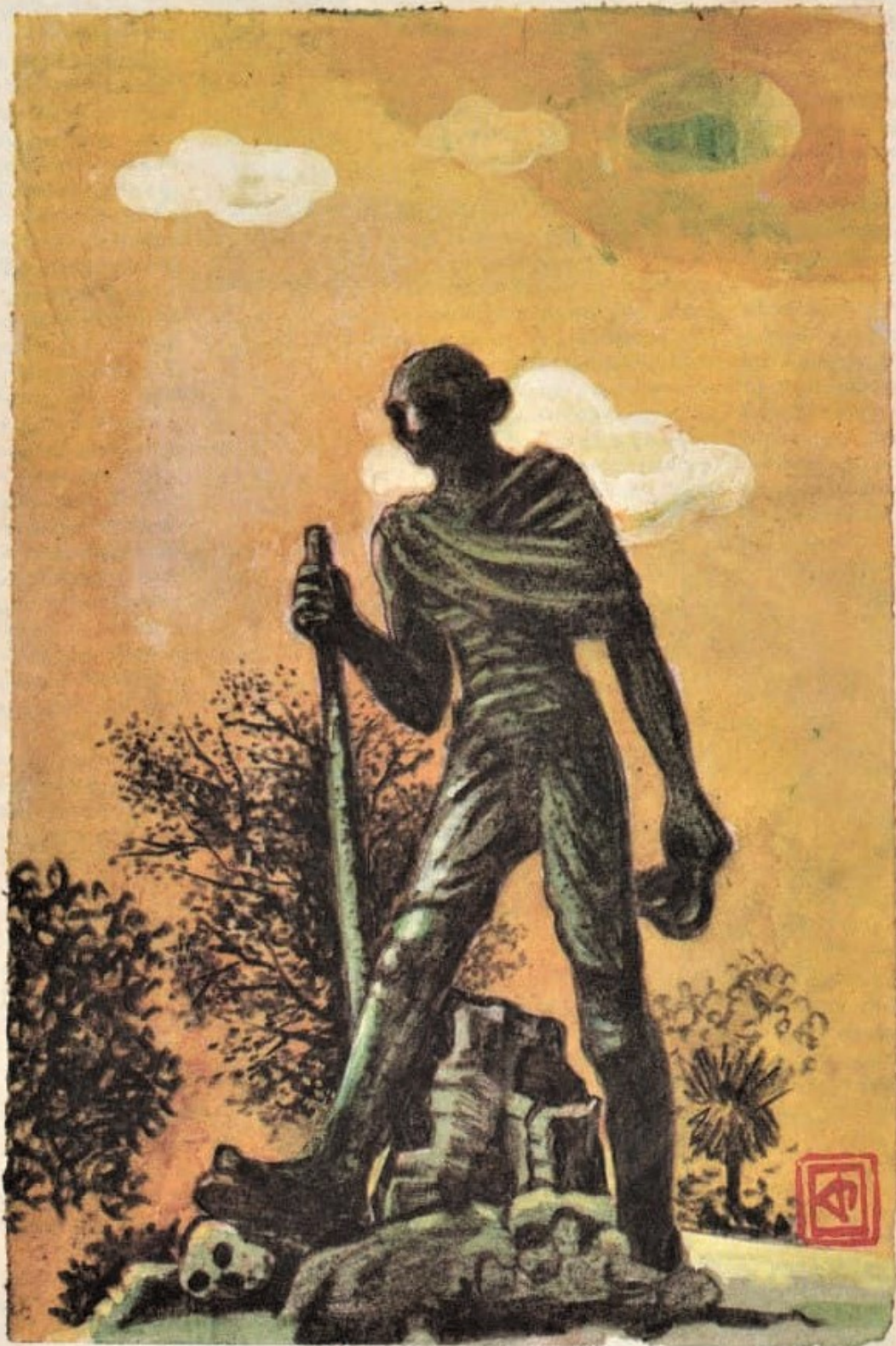
"Nanakali yathora" ... A sculpture by Ramkinkar Baij